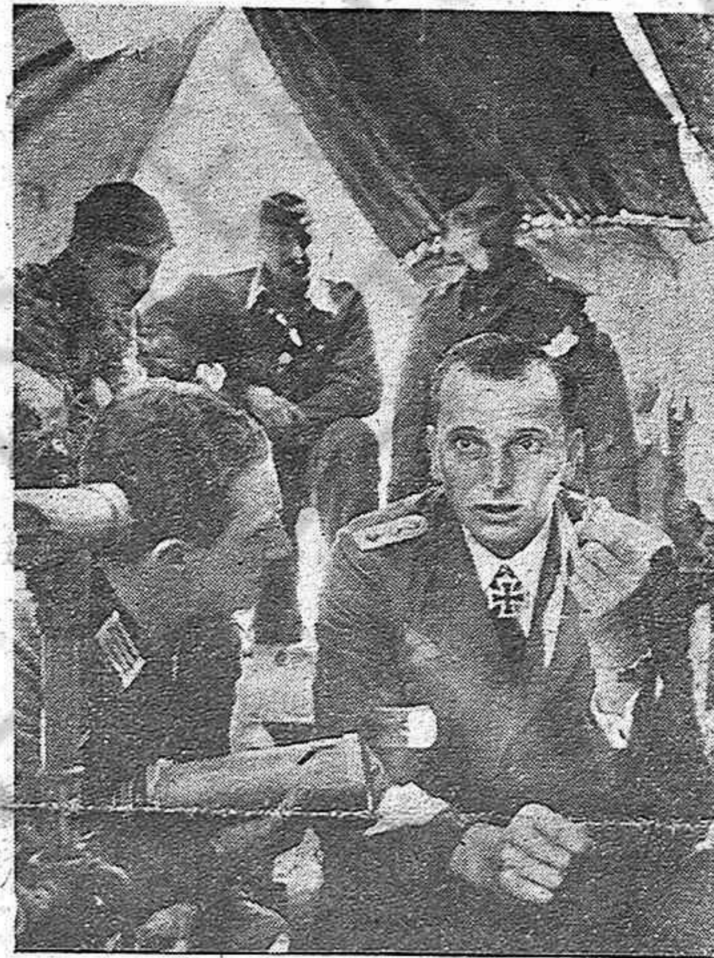
El capitán Kretschmer, que después de Prieg es el segundo comandante de submarinos laureado por haber hundido más de 200.000 toneladas de buques enemigos, relata a los corresponsales de guerra su última hazaña

Washington, 25. - Después de la conferencia de Roosevelt con el embajador británico Lothian, éste ha hecho unas declaraciones a los periodistas relatando su conversación con el presidente, quien le expuso que con la resistencia de Inglaterra obtendrá una situación satisfactoria en el futuro si recibe ayuda norteamericana. - Efe.