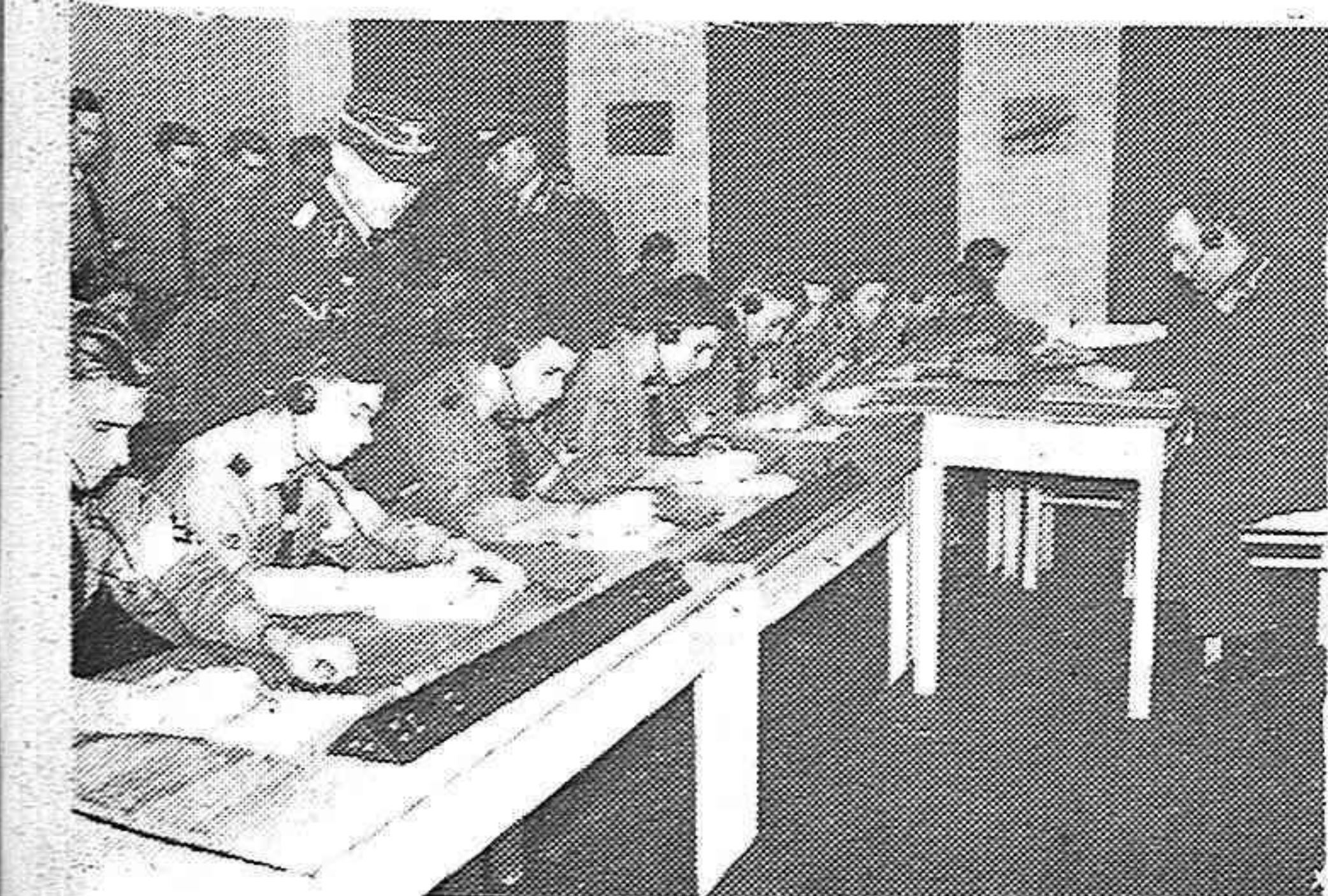
El Cuerpo de Aviación del Partido socialista prepara todos los años a miles de muchachos de las Juventudes Hitlerianas para su ingreso en la aviación del Reich. He aquí un cursillo de radio telegrafía en Viena.

Como complemento de fiesta los músicos se reunieron en una comida íntima donde se derrochó la alegría y el buen honor. En obsequio de la juventud adnamantina y correspondiendo al efecto que ella tiene para su Banda de Música, tocaron escogidas piezas bailables el día 23 de 7 a nueve de la noche.