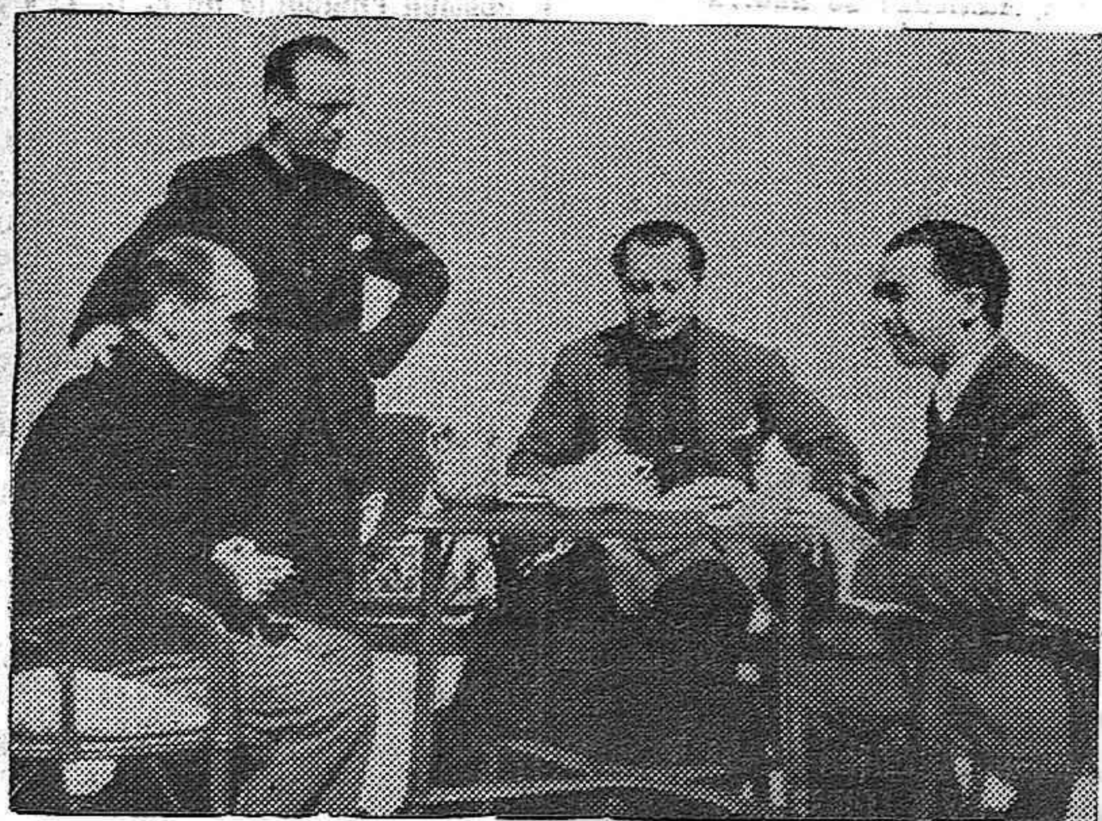
He aquí un momento en el que José Antonio en Gredos expone y discute con sus camaradas un plan de táctica. Están con él, Ruiz de Alda, Onésimo Redondo y Francisco Bravo.

Y aquí, en esta España rabiosa, malediciente y esperanzada, nosotros. Nosotros, con el apretado deber de conseguir la rota y prometida armonía. Nosotros con el tremendo peso de sangre y huesos innumerables, bajo el imperativo de tantas ilusionadas agonías. Nosotros, con el alma traspasada de impaciencia y de ambición. Nosotros, en esta dura amanecida del mundo, que solo nosotros hemos sabido ver. Resueltos—«como ayer, como siempre»—a que la mediocre dispersión, sea definitivamente hecha trabada y entusiasmada unidad. A que el hombre español tenga otra vez armónico contorno de intimidad, eternidad y poderío. (De «Arriba»)