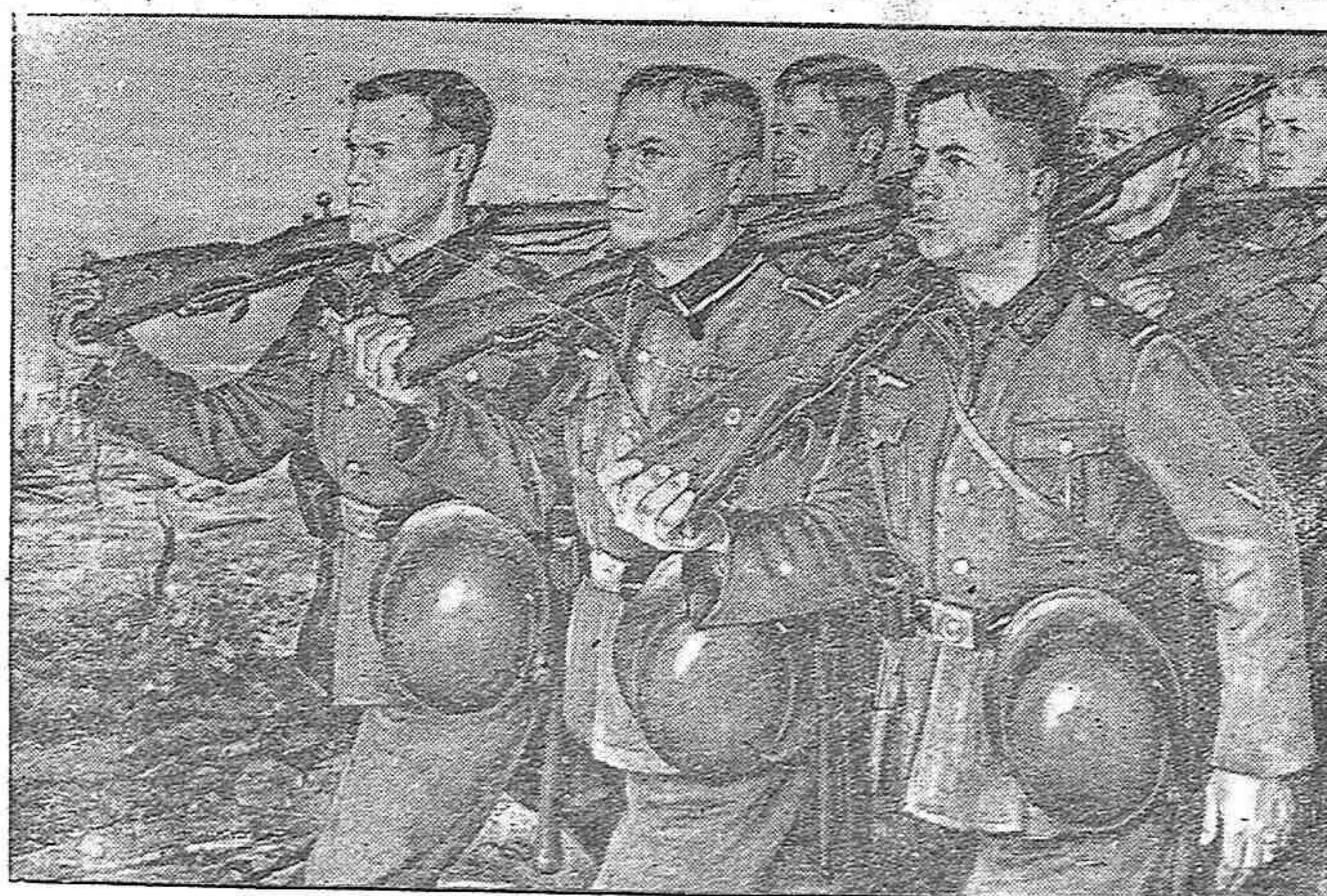
Exposición de Arte de Munich 1940.

Berlín, 13. — A última hora de la tarde se ha publicado el resumen de las operaciones efectuadas en el día de hoy. Aviones alemanes han atacado varios puntos del litoral inglés destruyendo instalaciones marítimas de los astilleros de Porthmouth y han derribado 40 aviones. El segundo ataque se dirigió contra las barreras de globos, cerca de Dover, destruyendo varios y reduciendo a silencio a las baterías anti-aéreas. Ha sido alcanzado el Aeródromo de Mauston alcanzándose la pista, los campamentos y los hangares destruyéndose cuatro aviones en el suelo y tres en el aire. Todos los aparatos germanos regresaron indemnes a sus bases. — Efe.