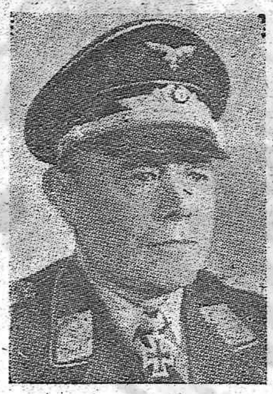
KESSELRING, del Arma aérea nombrado Mariscal de Campo

¡Devotos de la Virgen: al Pilar de Zaragoza!