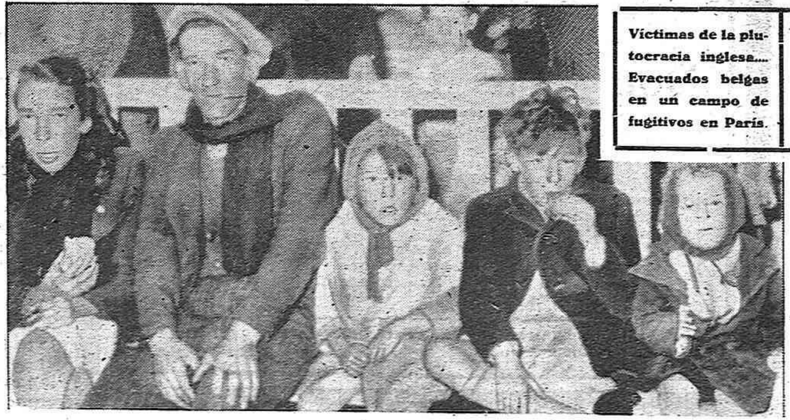
Victimas de la plutocracia inglesa... Evacuados belgas en un campo de fugitivos en París.

Frontera hispano francesa (especial para la Agencia Efe).—Antes del fin de esta semana se trasladará el Gobierno francés a la ciudad de Clermont Ferrand, ciudad que, en el mencionado hotel sea requisado un principio, había sido designada como residencia de los Poderes públicos para cuando llegara el caso de tener que abandonar París. La Embajada de España se irá a Clermont Ferrand el viernes o sábado, y ocupará un gran Hotel en la estación termal de Royat. El que el mencionado hotel sea requisado y todos sus servicios han quedado ya a disposición del embajador español.—Efe.