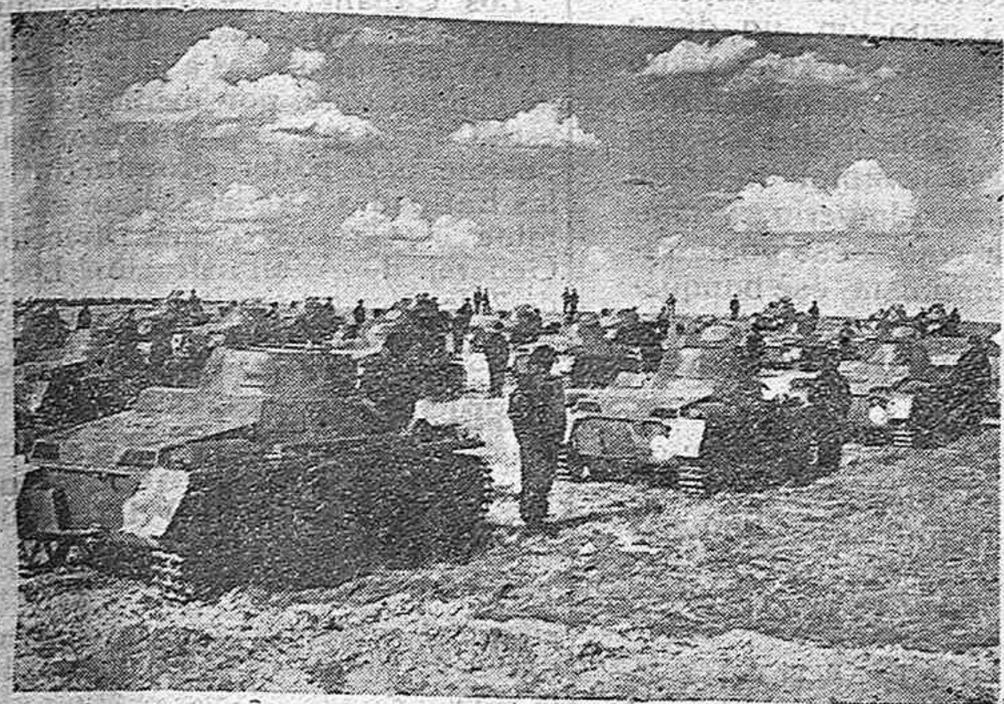
Los tanques alemanes esperan la orden de iniciar un avance. La foto está tomada en las inmediaciones de la línea Sigfrido.

Berlín, 13. - La prensa anuncia que la noticia según la cual la Legación de la Argentina y el palacio de la Nunciatura en La Haya, habían sido bombardeados siendo completamente destruida la capital de este último, es completamente falsa. Se trató sólo de una pura invención de propaganda con el fin de excitar los sentimientos de los países católicos contra Alemania. - Efe.