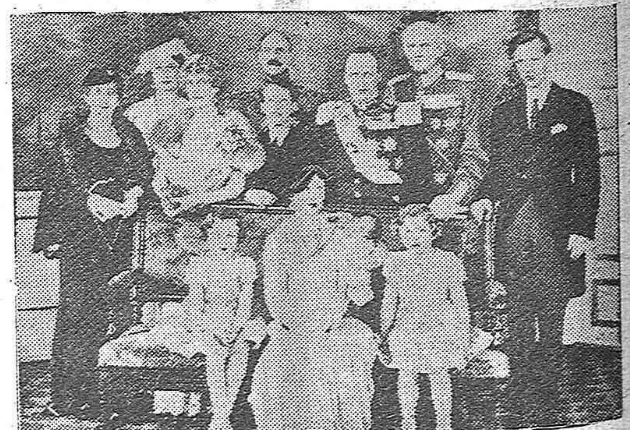
El rey Haakon defenderá su país contra Alemania. En la foto se ve rodeado del Príncipe heredero y de la princesa Marta con sus hijos, que según últimas noticias, ya ha pasado la frontera con dirección a Estocolmo.

Ambas reuniones, a las que asistieron también los embajadores en Roma y Moscú, fueron suspendidas ayer, a consecuencia de los acontecimientos en Noruega y Dinamarca.