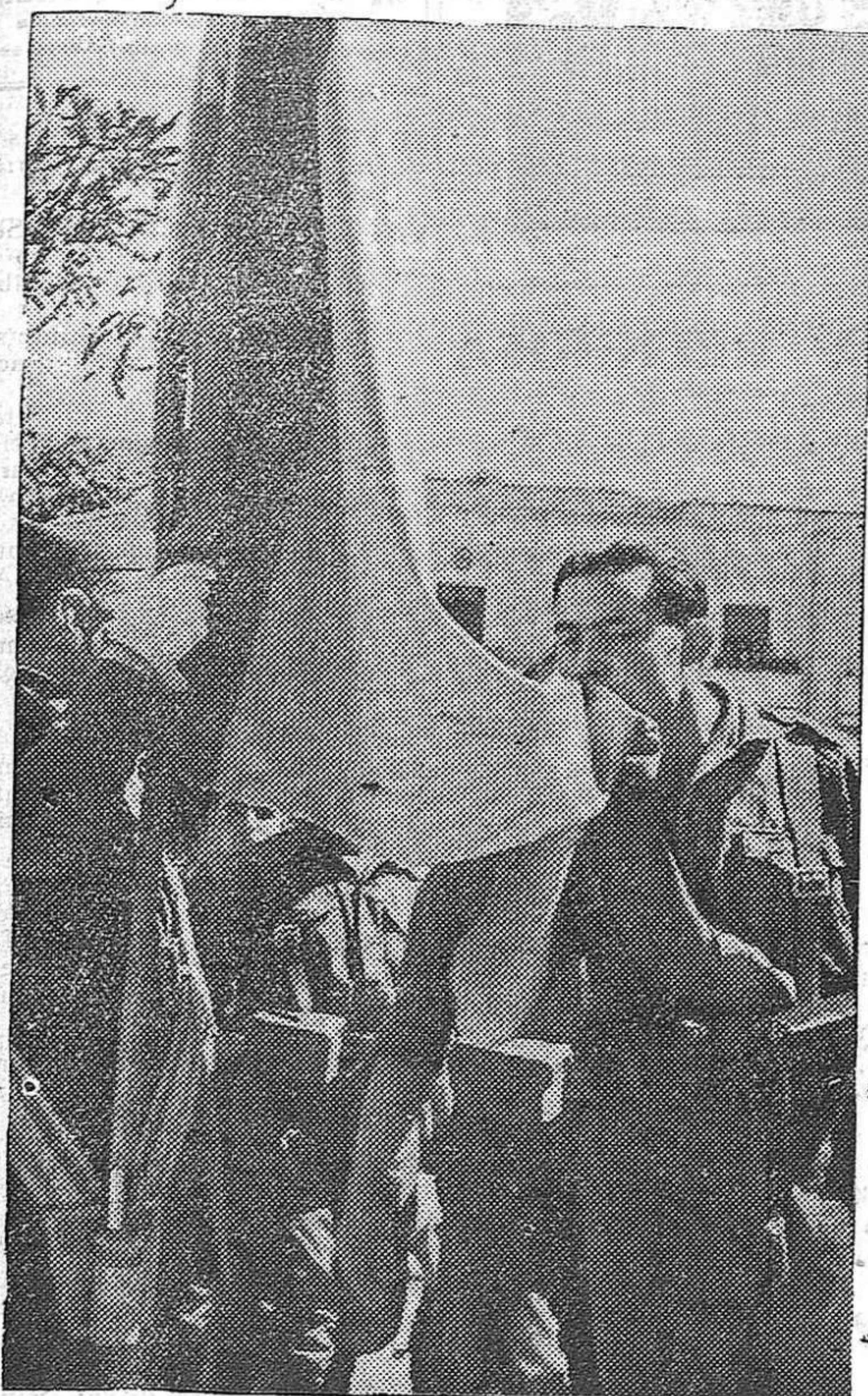
En Bilbao se celebró días pasados la jura de bandera de los nuevos alféreces de Infantería pronunciando un bellísimo discurso el camarada Delegado Nacional de Prensa y Propaganda de Falange Española Tradicionalista y de las Jons, Fermín Yzuriaga. Fué un ejemplo más del rico espíritu patriótico que vibra en toda España y que adquiere todo vigor en estos actos solemnes de consagración a la Patria y a sus Armas.