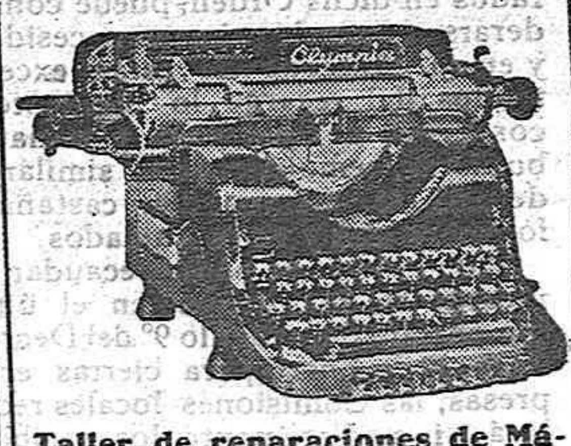
Taller de reparaciones de Máquinas de ESCRIBIR, CALCULAR y CO-ER

MAXIMO ANTON TECNICO MECANICO CLAUSTRILLA, 7 SORIA