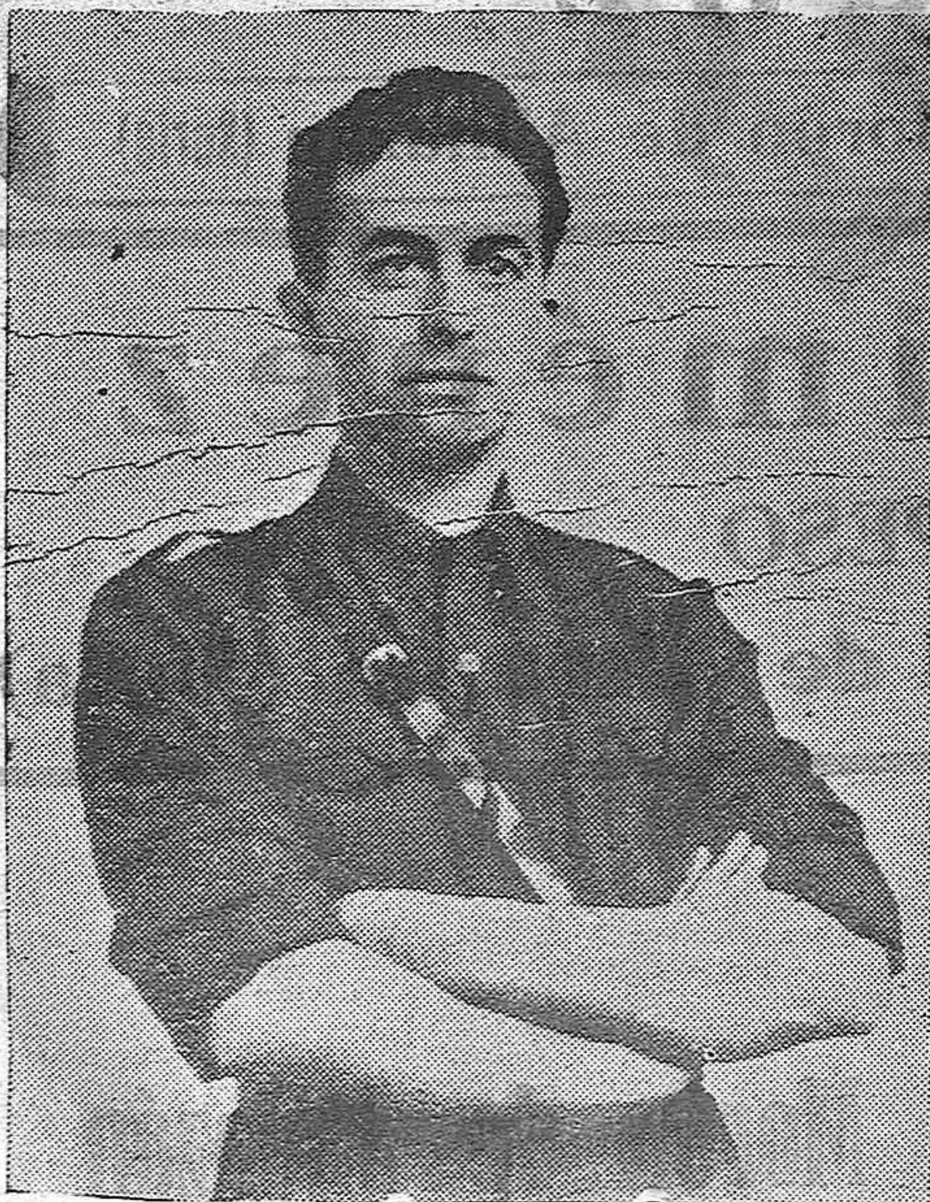
Onésimo Redondo, Adelantado del ideal y de la muerte puestos al servicio de España, a quien va a erigirse un monumento en el Cementerio de Valladolid