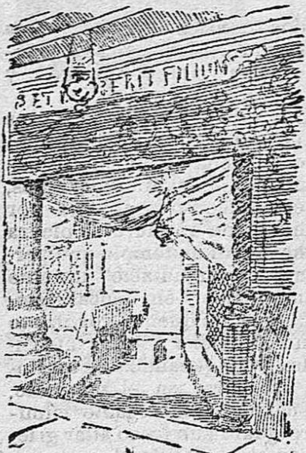
Nicho del Pesebre

las paredes talladas en mármol blanco cubiertas, en parte, por colgaduras de púrpura y oro con innumerables lámparas pendientes de la bóveda. El pesebre está a la derecha del nicho de la Natividad, sostenido por dos columnatas, en otra cavidad, siendo también de mármol y las múltiples lámparas su principal decoración.