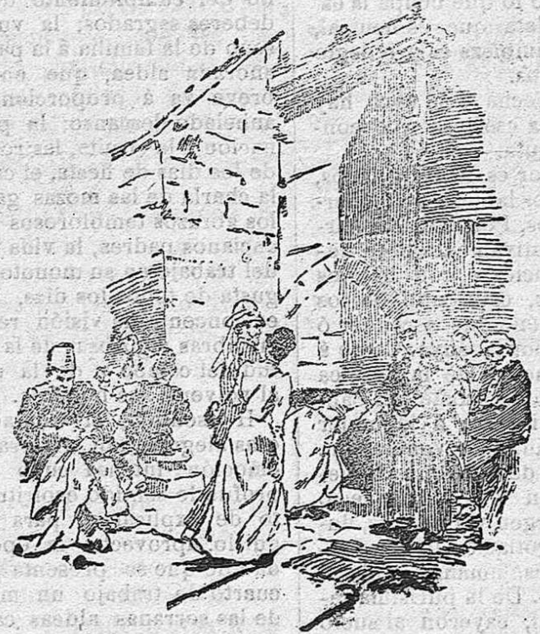
Basílica de la Natividad — Puerta Principal

Aproximándose á él; se distingue, en efecto, una bajísima puerta: es la entrada á la Basílica de la Natividad.