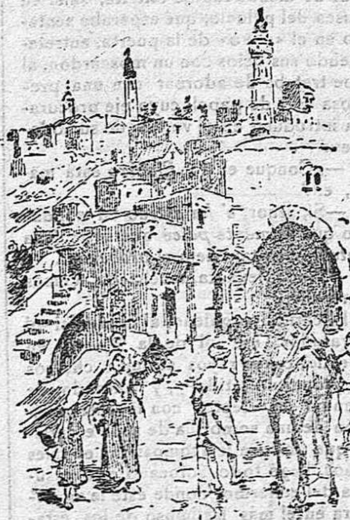
Belén y Puerta de Jerusalén

Penetrando en la ciudad por la parte de Jerusalén nos encontramos en una calle estrecha y tortuosa, que corta á Bethlem, en casi su longitud, á su fin esta vía enlaza con una plaza oblonga, que, á su vez, desemboca en una explanada, que es el anti-