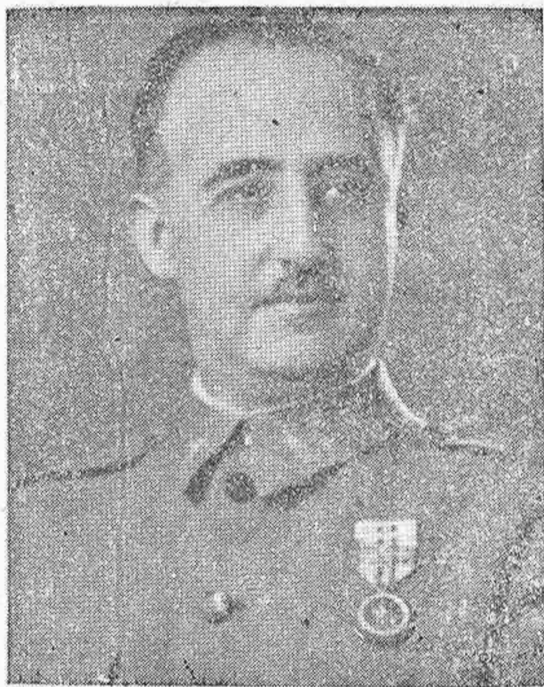
Nuestro invicto Caudillo

Se proponía el marxismo terminar con todo lo que significa tradición, catolicismo, familia, derecho etc. etc, pero esta España siempre leal a sus principios y convicciones, en aquella gesta heroica de conjunto, compenetrada con el ideal de su Caudillo salvador, no vaciló por un solo momento para enfrentarse contra sus huestes demoledoras; contuvo brillantemente a la fiera soviética infiltrada en el territorio y ya nos encontramos tocando al fin de la derrota de su obra nefasta por que el ímpetu arrollador y de gran empuje de los soldados de Franco, han desmoronado los planos moscovitas que se imaginaron sin realización posible.