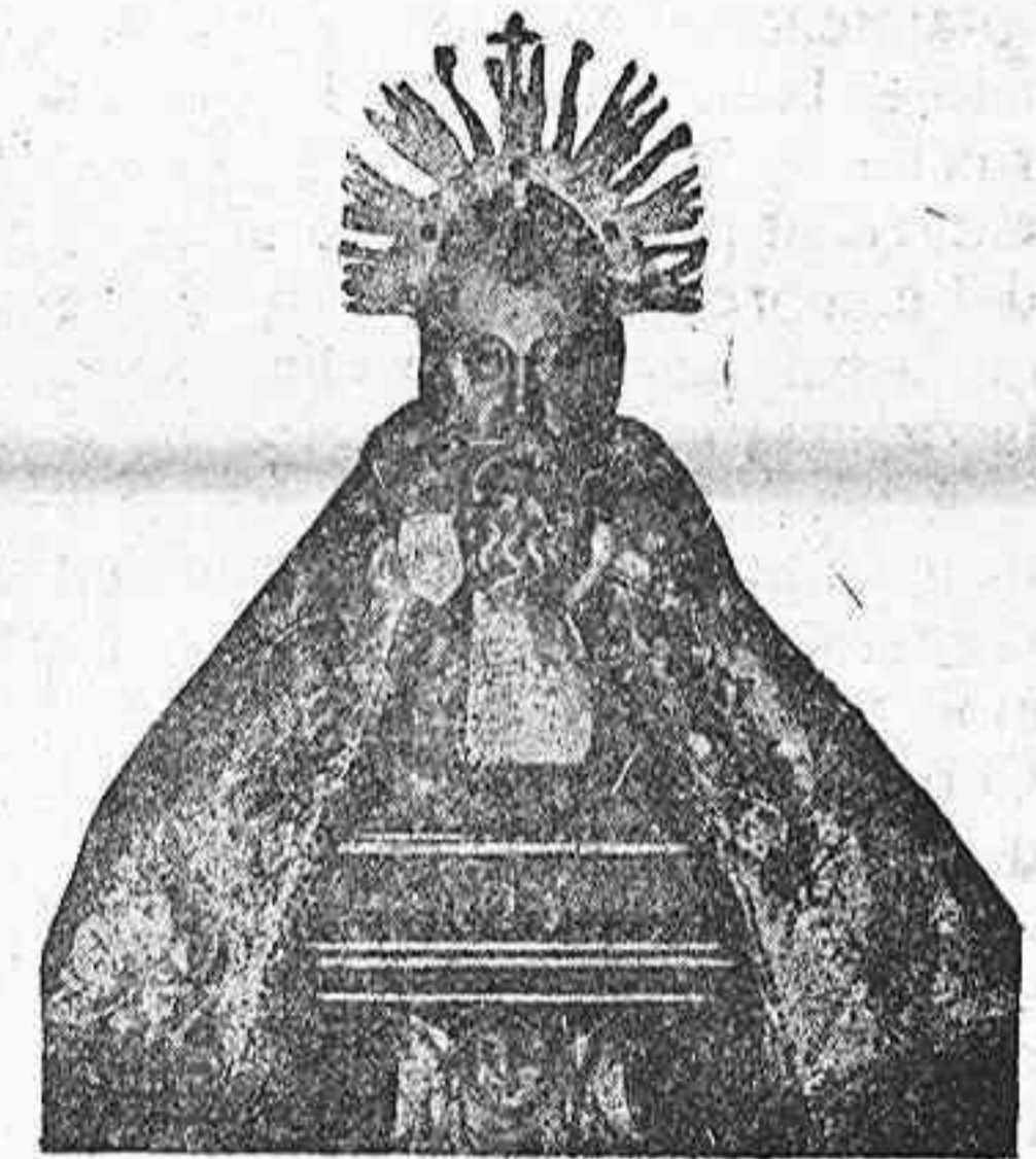
San Saturio Patron de Soria

Pues meditamos con juicio sereno, obremos y practiquemos como San Saturio aquellas máximas de recogimiento y de amor a los pobres ya que la caridad y la justicia que siguen su misma línea paralela e inseparable, han de hacernos dignos creyentes fortaleciendo el espíritu que la codicia con sus armas demoledoras nos arrancó en mala hora haciendo.