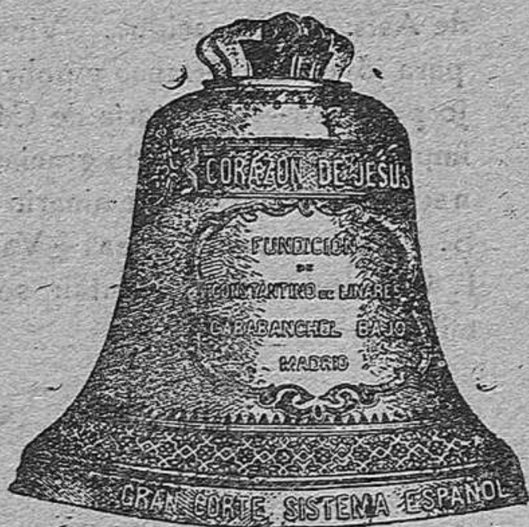
Campana forma Esquilón

Para mandar presupuesto fijo del coste es necesario remitan a la casa los diámetros de filo a filo de las campanas, bien en forma Romana o Esquilón.