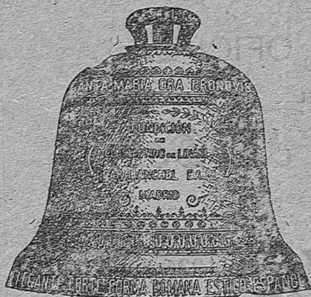
Campana forma Romana