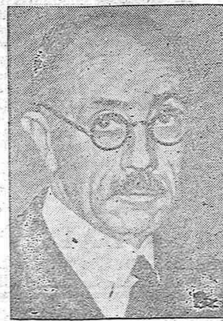
EL CONDE TILAKI muerto recientemente. Durante su dirección del gobierno húngaro se efectuó la unión de Hungría al Eje