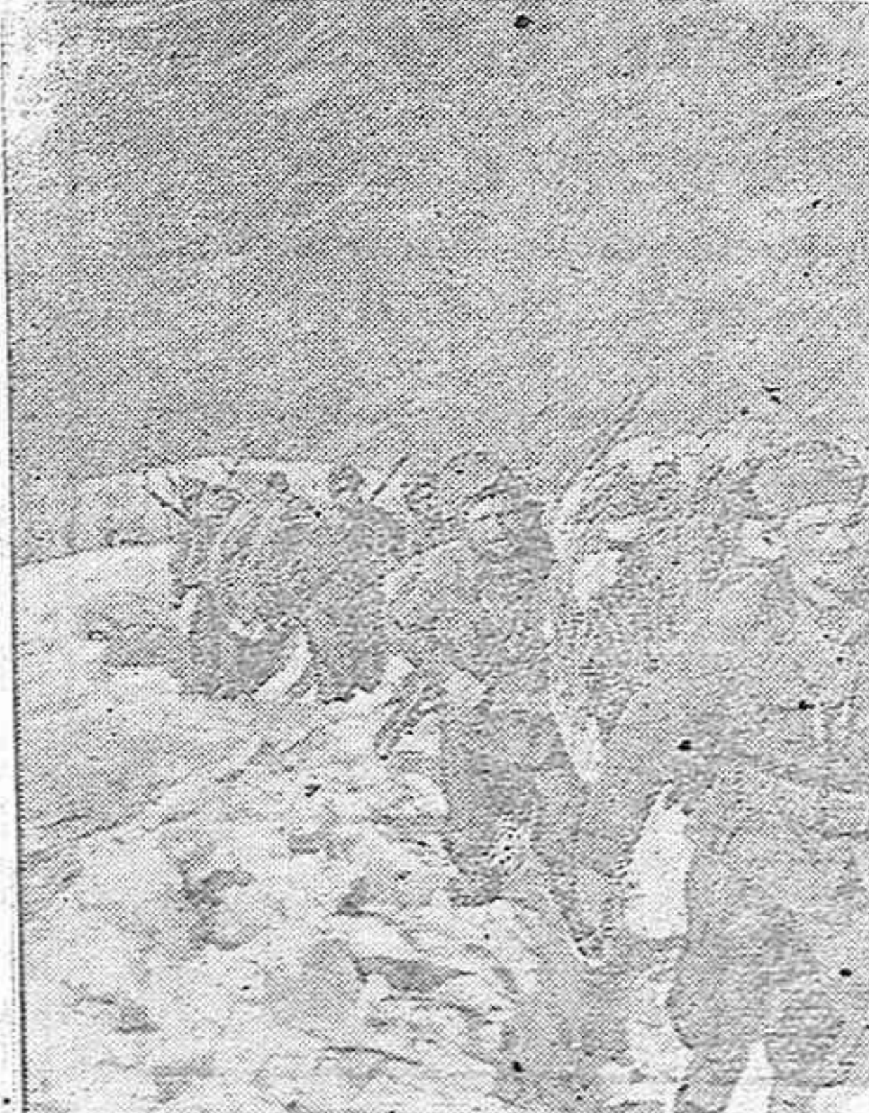
Alpinos italianos marchando sobre Grecia