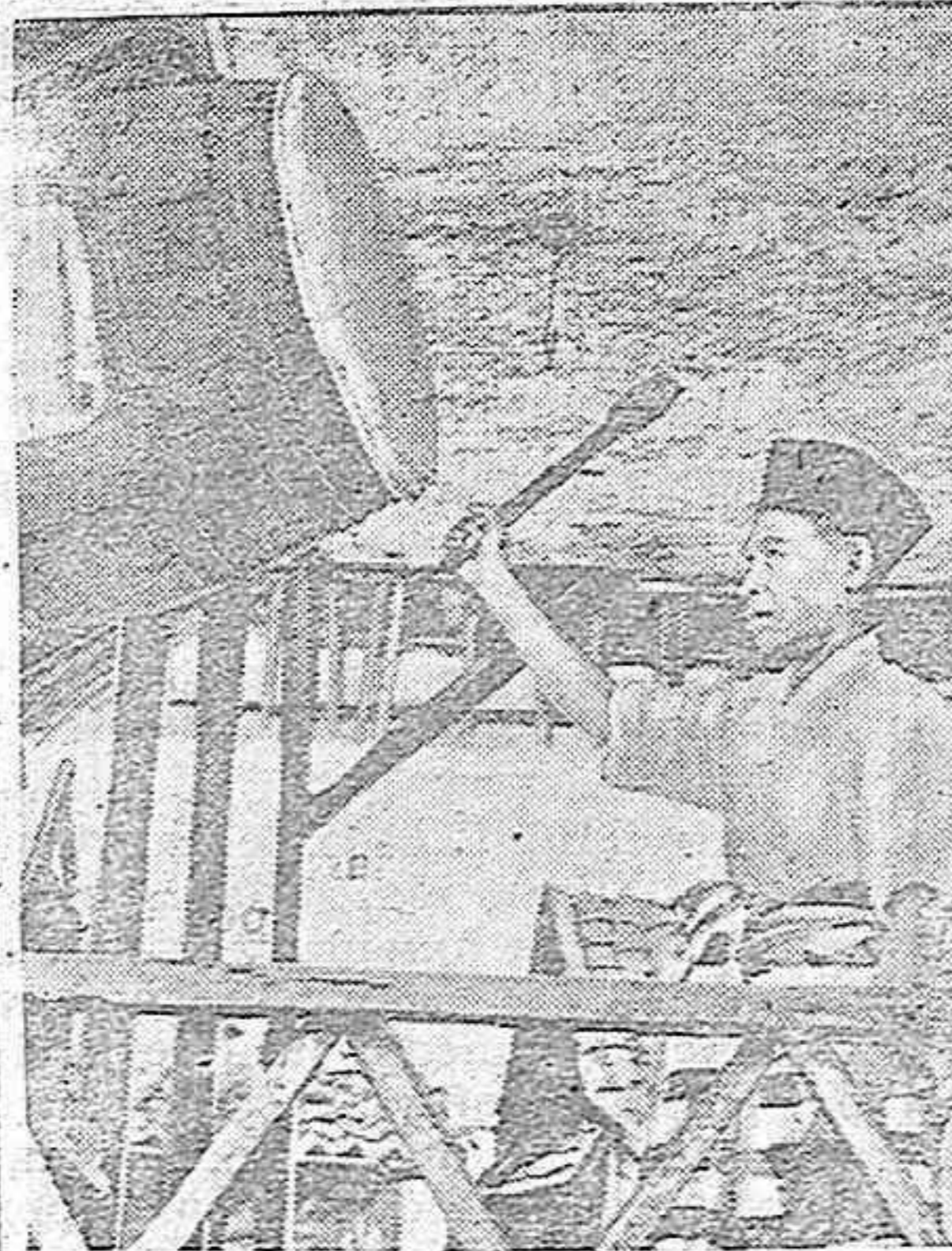
En las Indias neerlandesas el tambor reemplaza la sirena de alarma aérea