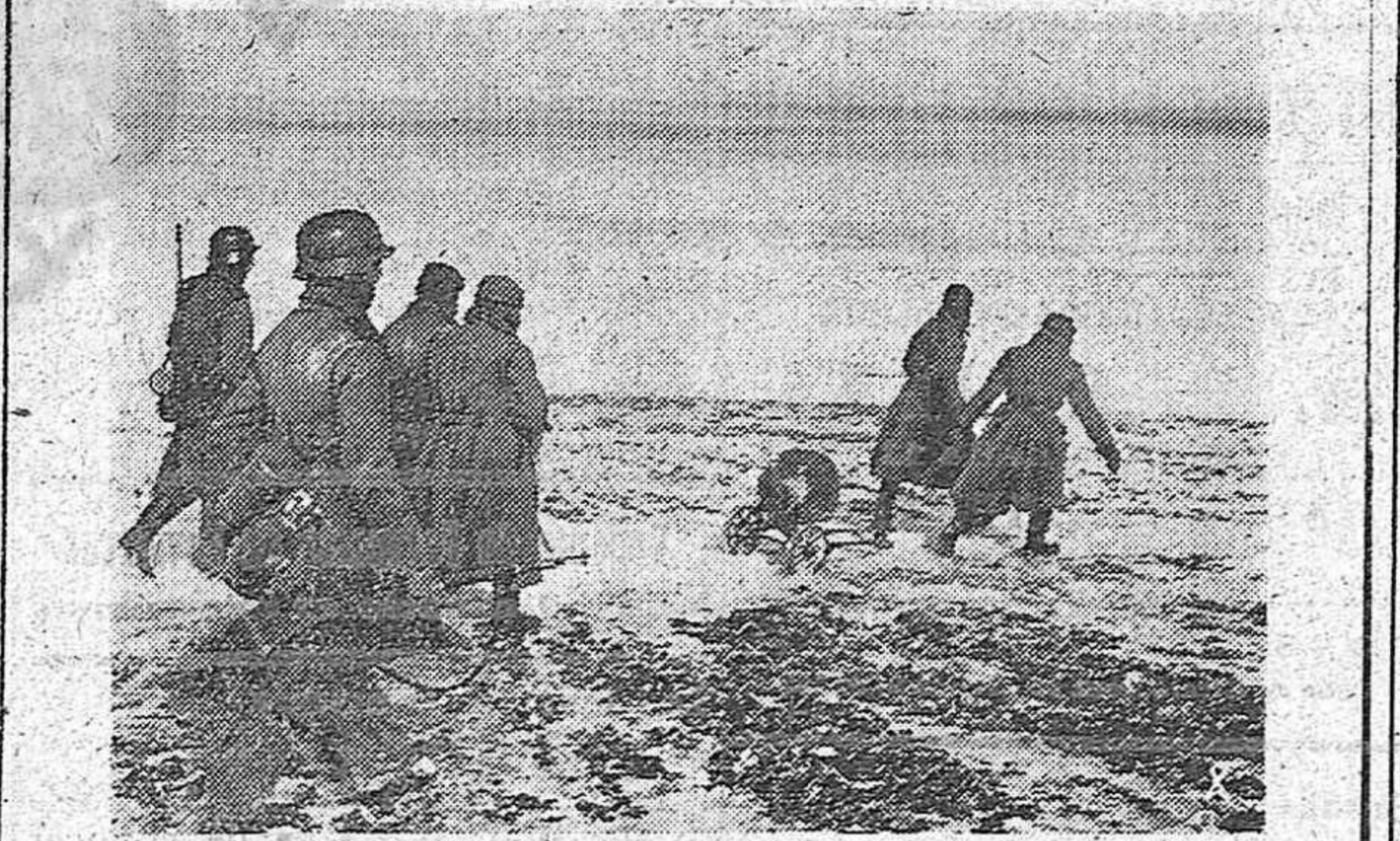
Un pelotón alemán de exploración ha capturado algunos soldados soviéticos y una ametralladora, con lo que vuelven victoriosos a su campamento