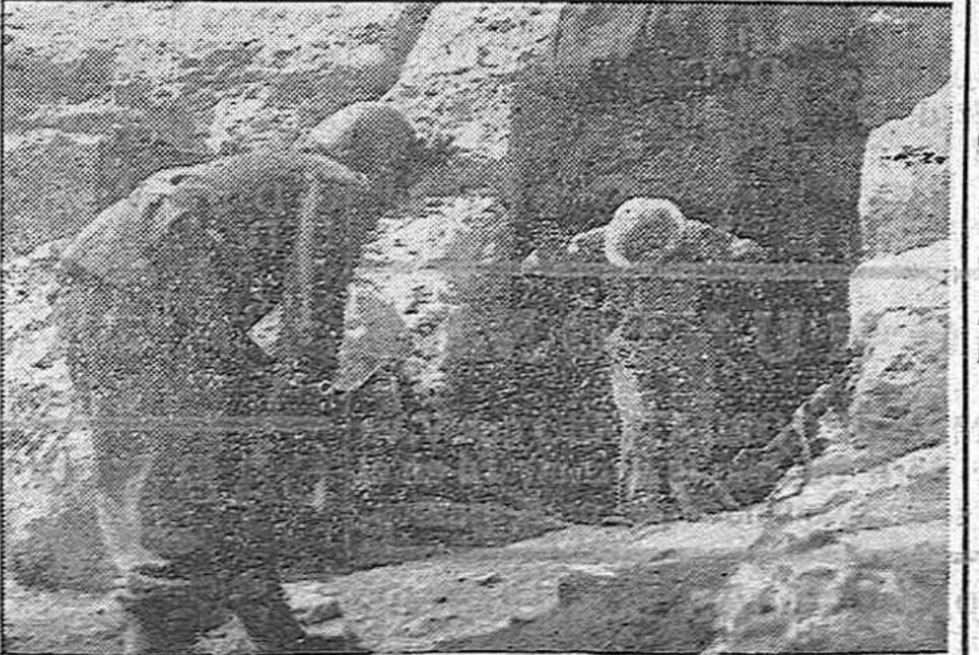
2. Un soldado británico sale de un fortín en África para entregarse a las tropas del Eje