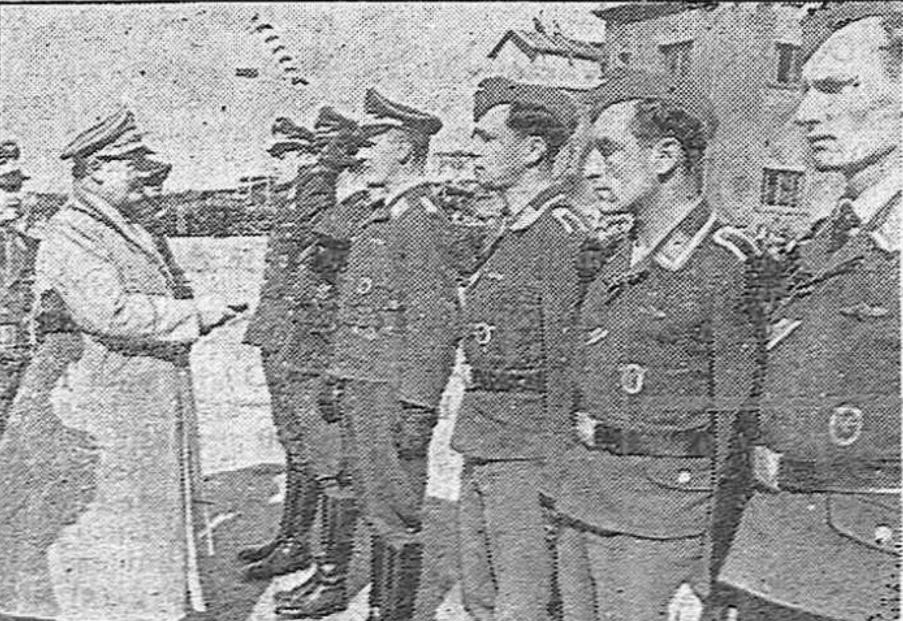
1. El mariscal del Reich Hermann Goering saluda a un grupo de aviadores alemanes destacados en Sicilia, durante su última visita a Italia.