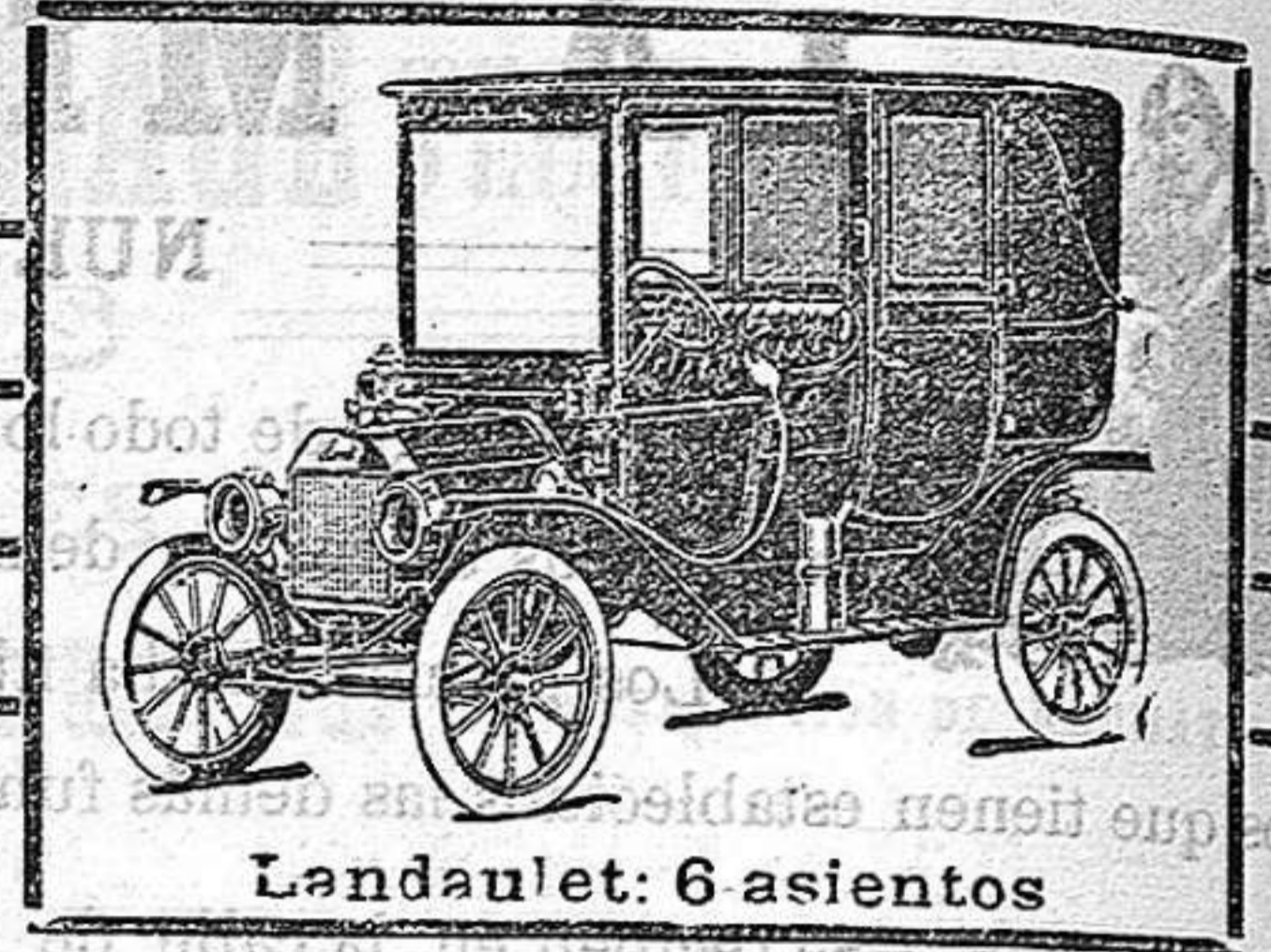
Landaulet: 6 asientos

Los coches de esta acreditada marca son los mejores, los más elegantes, los más sólidos y los más positivos.