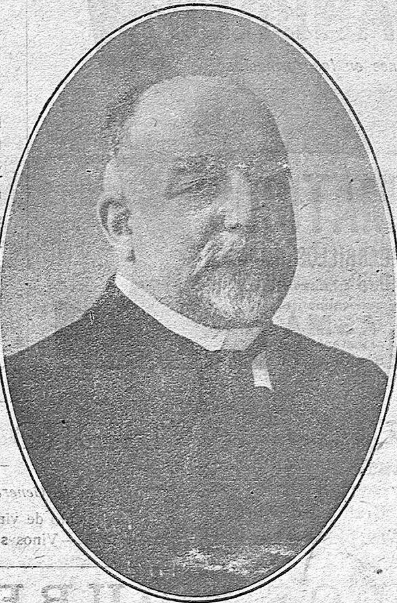
Excmo. Sr. D. Diego Arias de Miranda

ANUNCIOS.—A precios convencionales. Se ven: En Madrid, «Sociedad Española»; en Barcelona, Roldós y Compañía; en la Habana (Cuba), «Los Aliados».