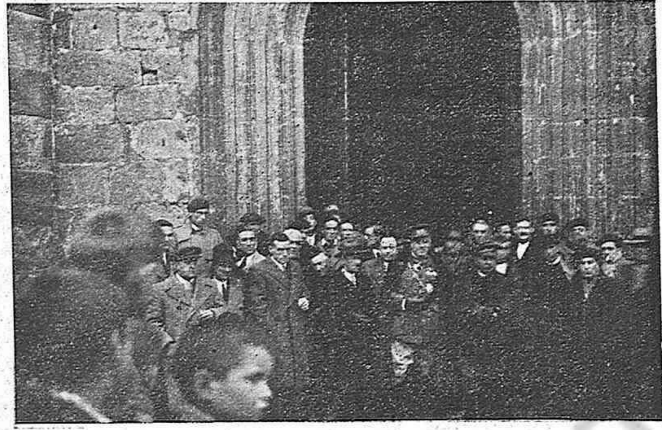
Don Juan Yagüe Blanco, acompañado de las autoridades, al salir de la iglesia parroquial.