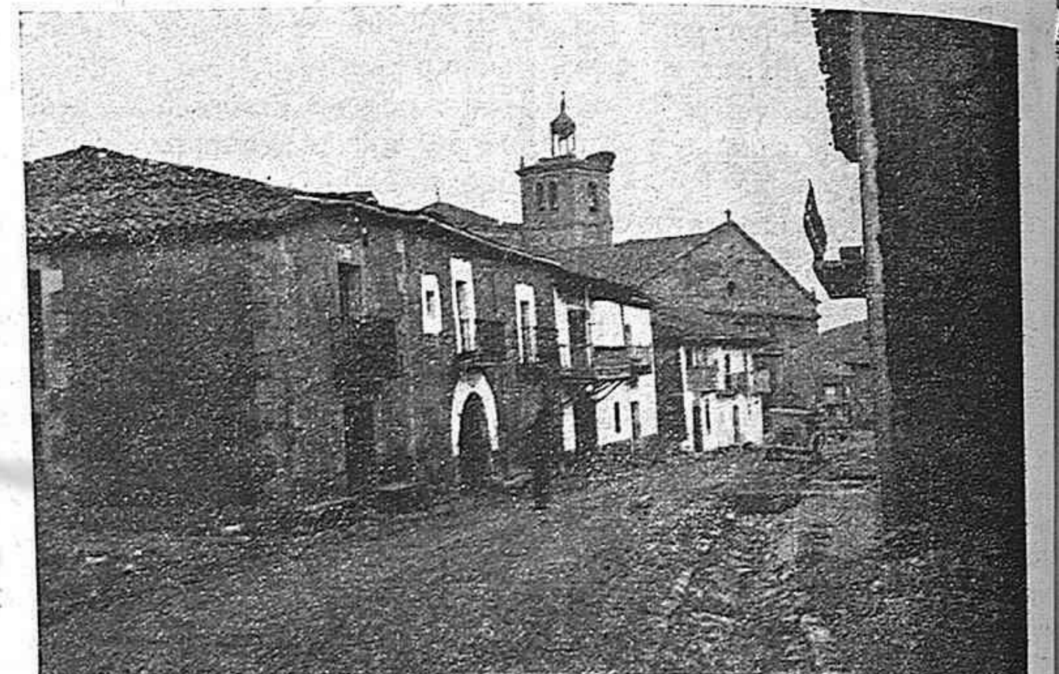
Una calle típica de la villa de San Leonardo.