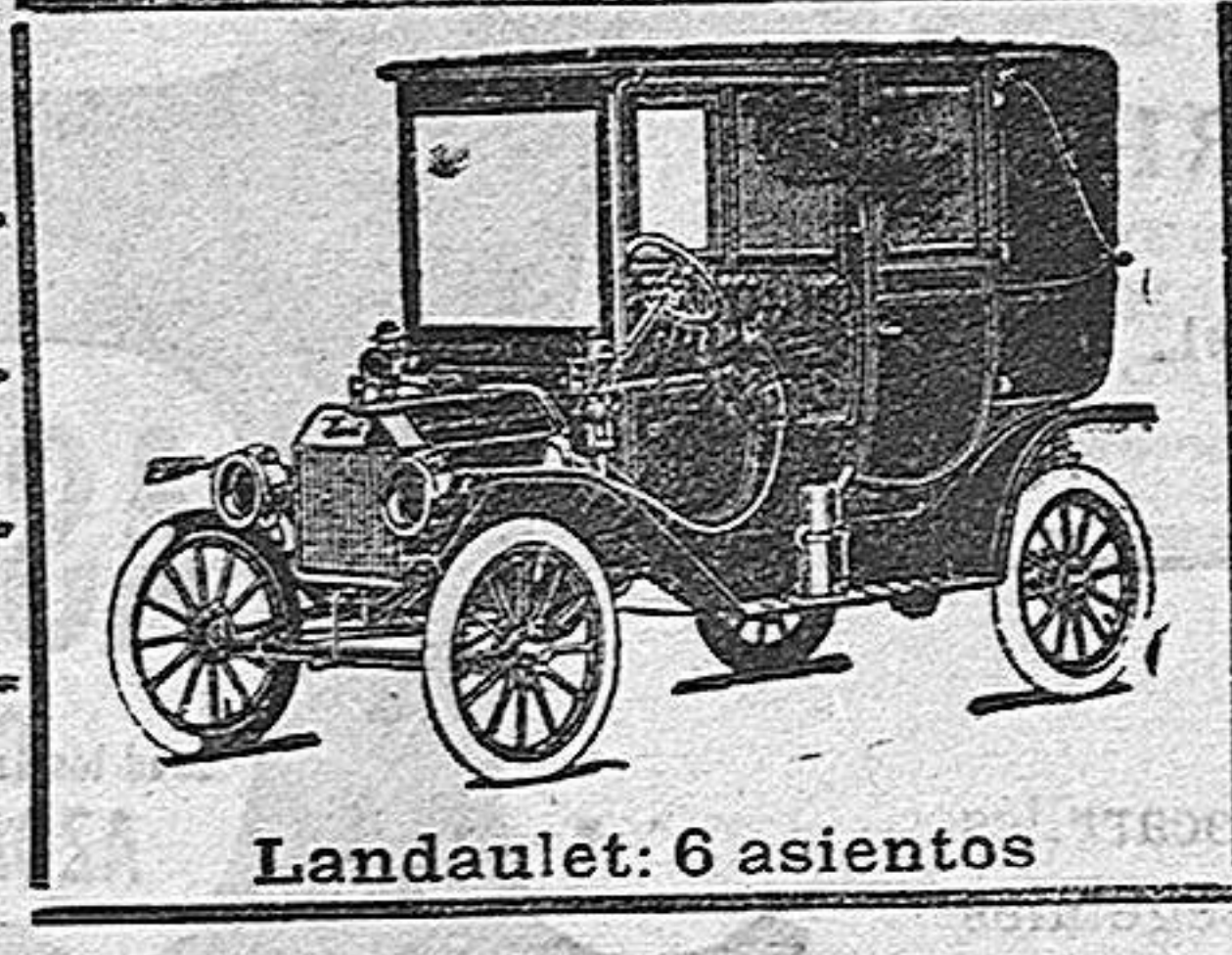
Landulet: 6 asientos