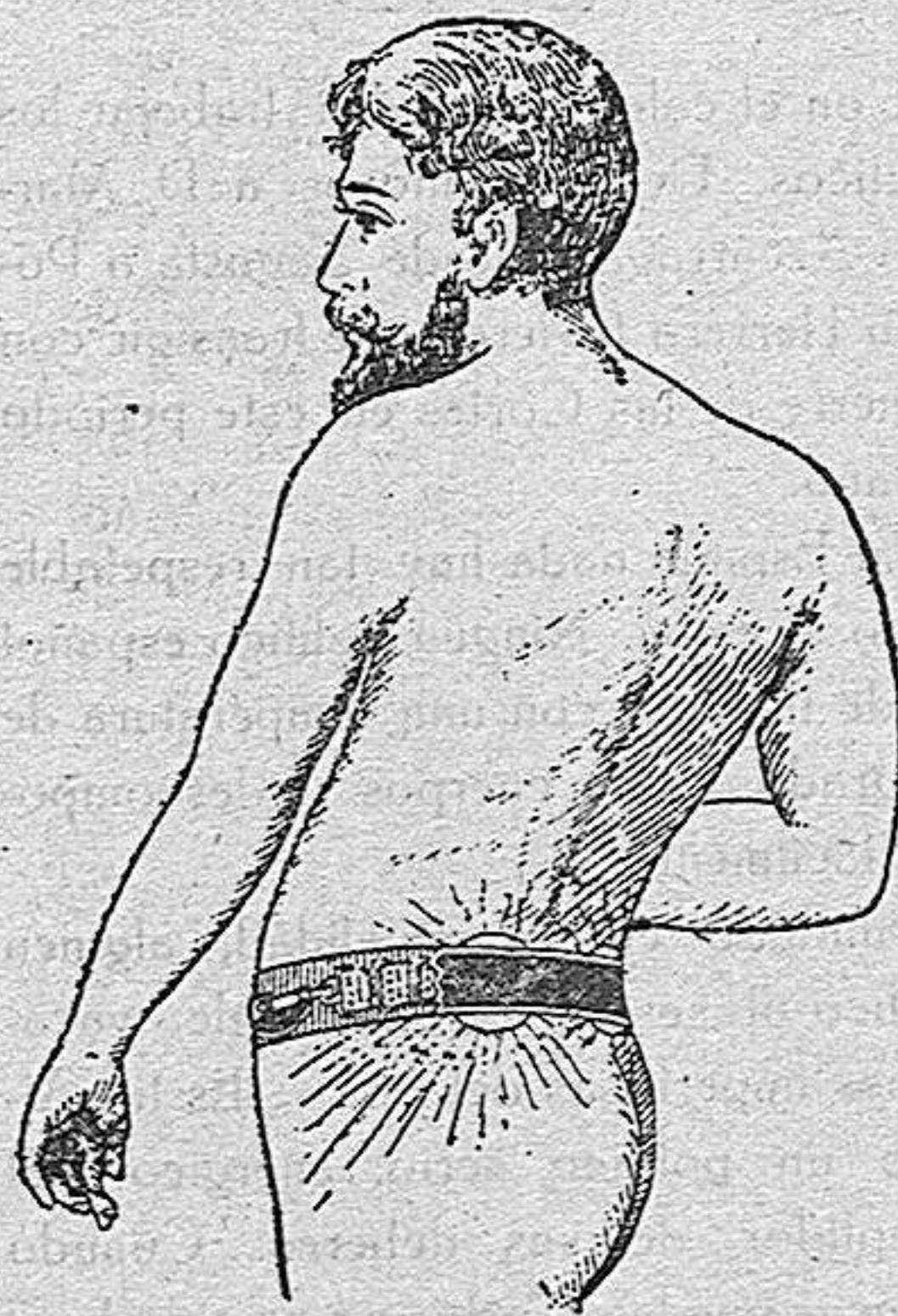
Marca registrada. Núm. 28.457