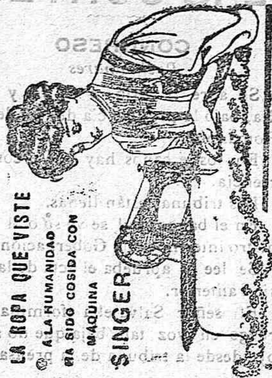
LA ROPA QUE VISTE A LA HUMANIDAD HA SIDO COSIDA CON MÁQUINA SINGER

A los suscriptores se les hace un 25 por 100 de rebaja.