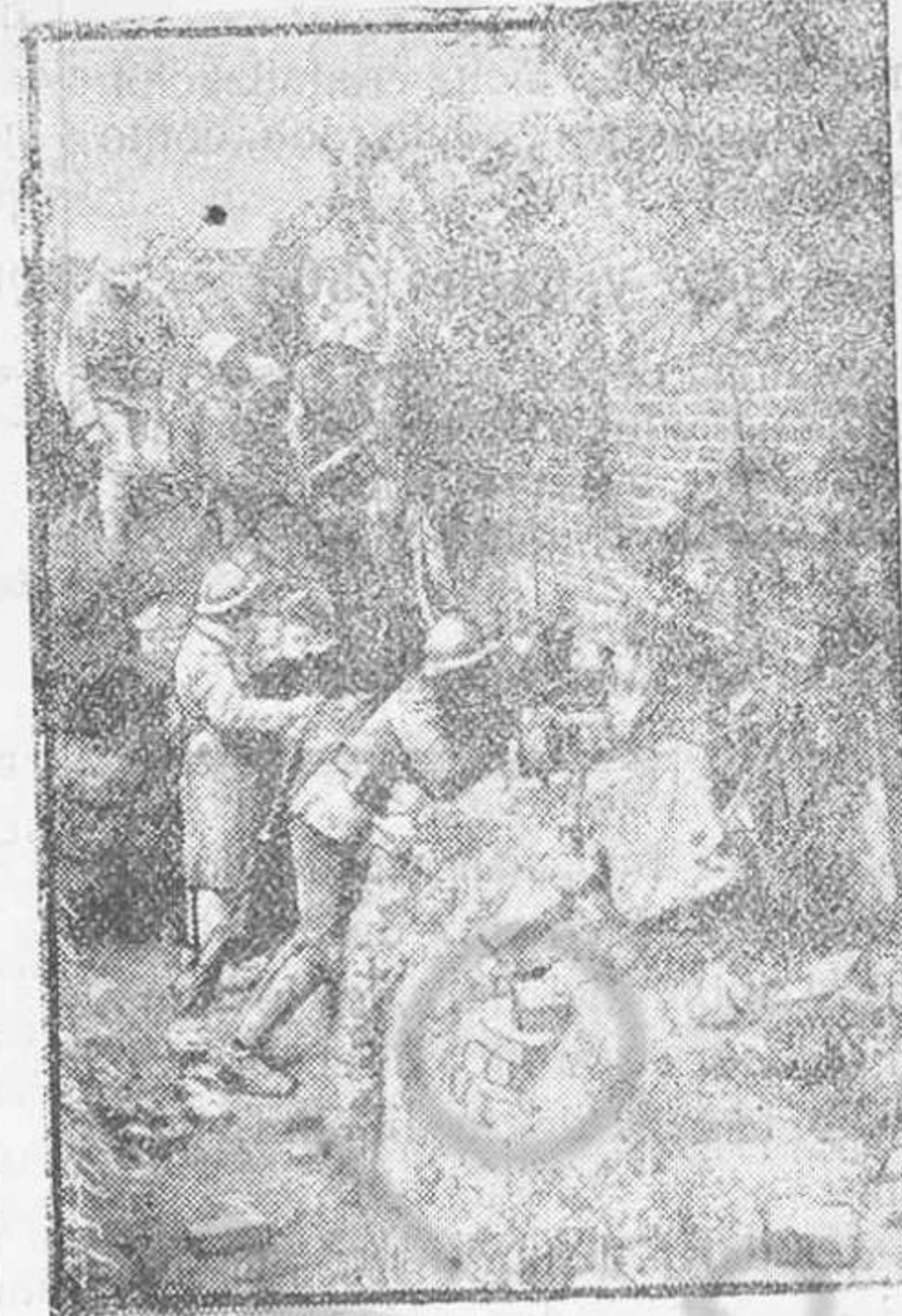
LA GUERRA EUROPEA.—El acecho detrás del muro de un parque

En Rusia está realizándose un gran movimiento de ideas, una evolución en las almas. La guerra pasará, es preciso que la alianza subsista. Cualquiera que sea el resultado de la lucha, esta marcará para mi país una fecha memorable. El tiempo lo dirá.»