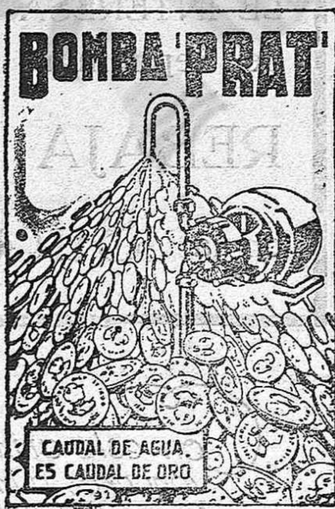
CAUDAL DE AGUA ES CAUDAL DE ORO

AGUA A COMODIDAD, SIN GASTES NI INTERRUPCIONES, Y CON UN CONSUMO DE FLUIDO INSIGNIFICANTE