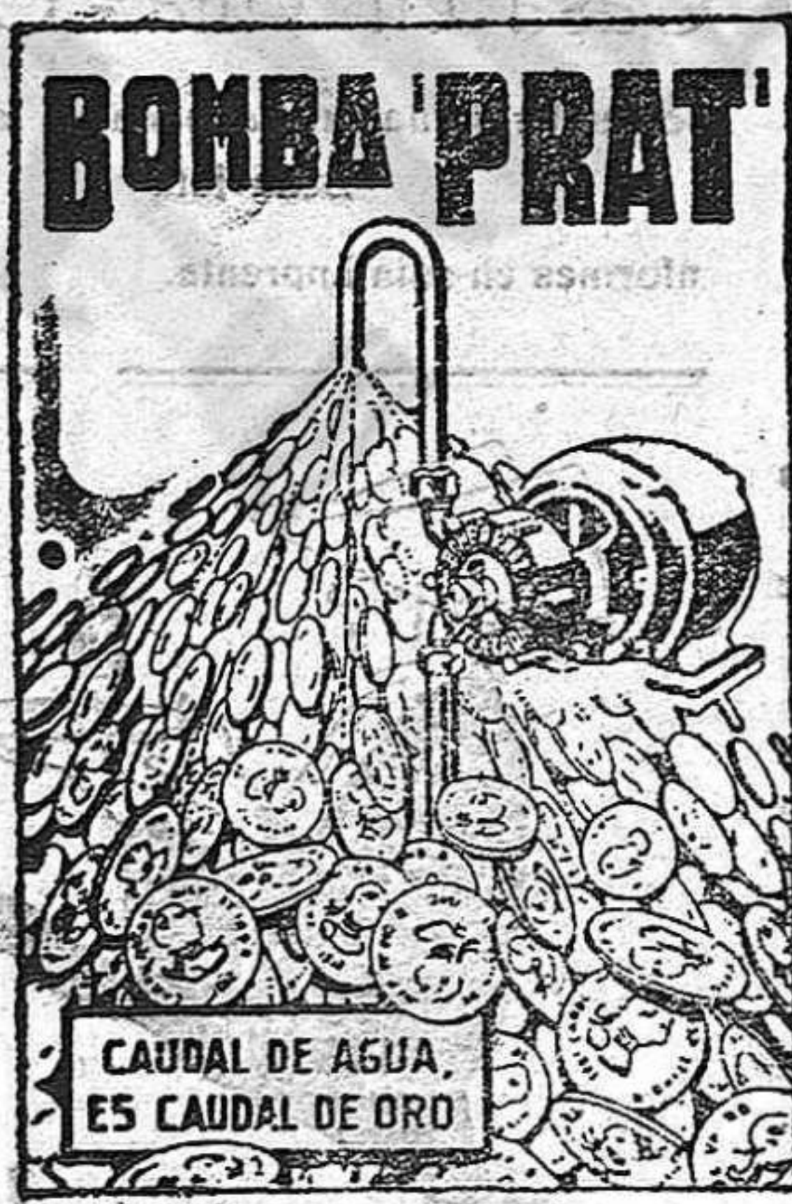
CAUDAL DE AGUA, ES CAUDAL DE ORO

GRAN AUXILIAR DE LA AGRI- CULTURA DE LA INDUSTRIA Y DEL HOGAR