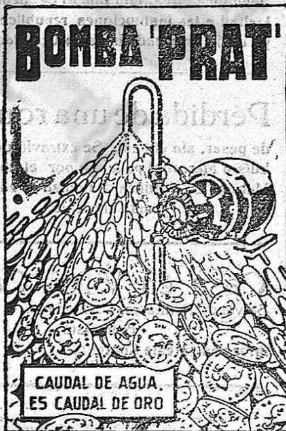
CAUDAL DE AGUA, ES CAUDAL DE ORO

AGUA A COMODIDAD, SIN GASTES NI INTERRUPCIONES, Y CON UN CONSUMO DE FLUIDO INSIGNIFICANTE