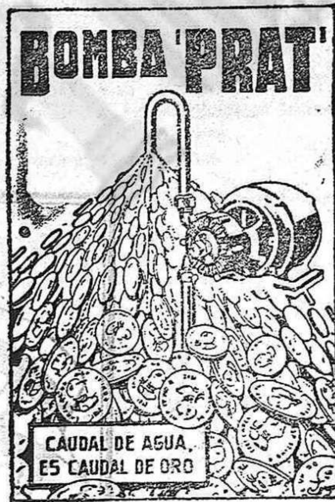
CAUDAL DE AGUA. ES CAUDAL DE ORO

AGUA A COMODIDAD, SIN GASTES NI INTERRUPCIONES, Y CON UN CONSUMO DE FLUIDO INSIGNIFICANTE