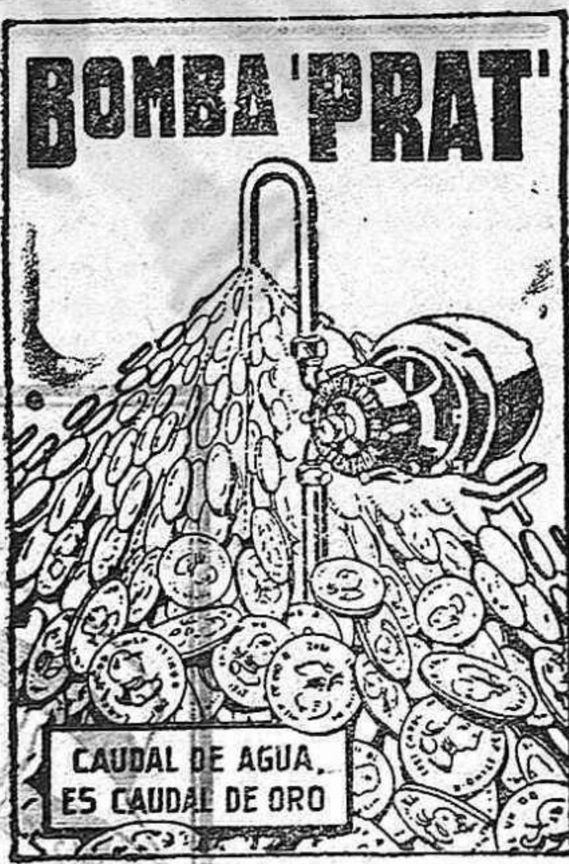
CAUDAL DE AGUA ES CAUDAL DE ORO

AGUA A COMODIDAD, SIN GASTES NI INTERRUPCIONES, Y CON UN CONSUMO DE FLUIDO INSIGNIFICANTE