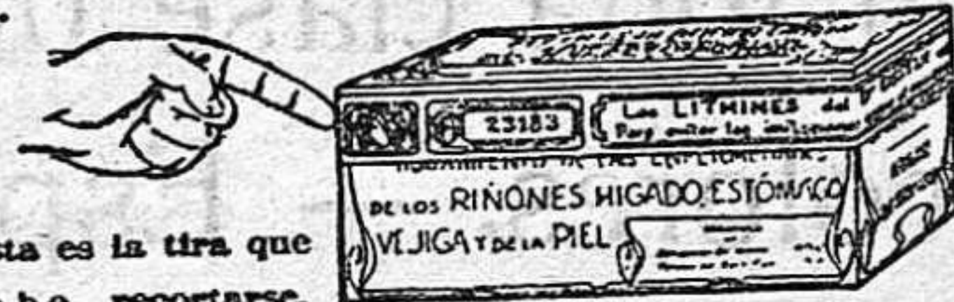
Esta es la tira que debe recortarse.

Representantes generales para España: Establecimientos Dalmáu Oliveres, Sociedad Anónima. P.º Industria, 14. Barcelona.