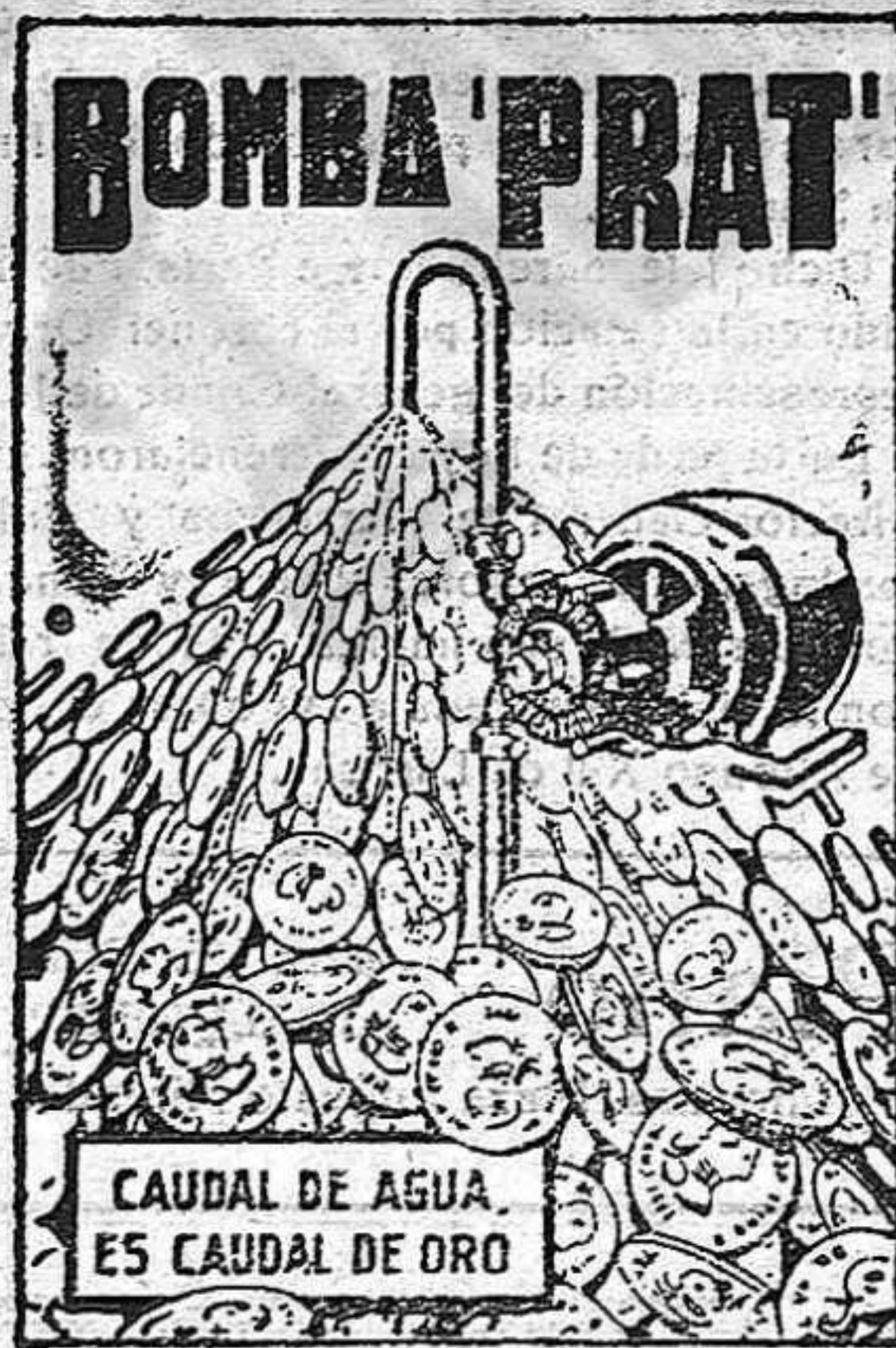
CAUDAL DE AGUA ES CAUDAL DE ORO

AGUA A COMODIDAD, SIN GASTES NI INTERRUPCIONES, Y CON UN CONSUMO DE FLUIDO INSIGNIFICANTE