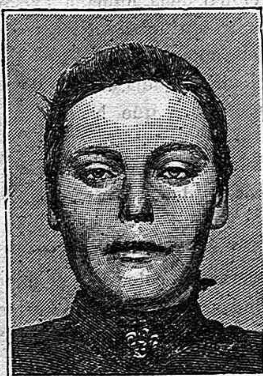
Después de 6 días de curación