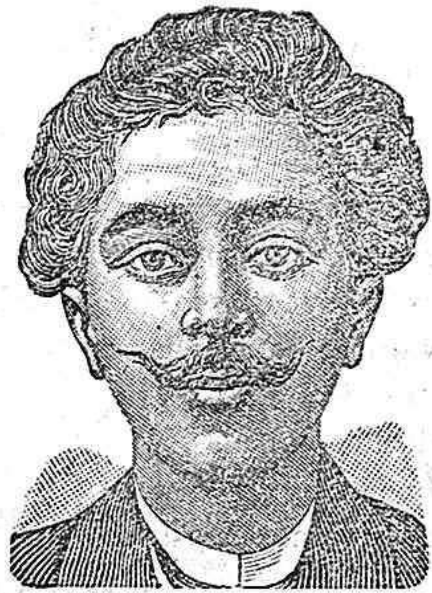
Después de 15 días de curación