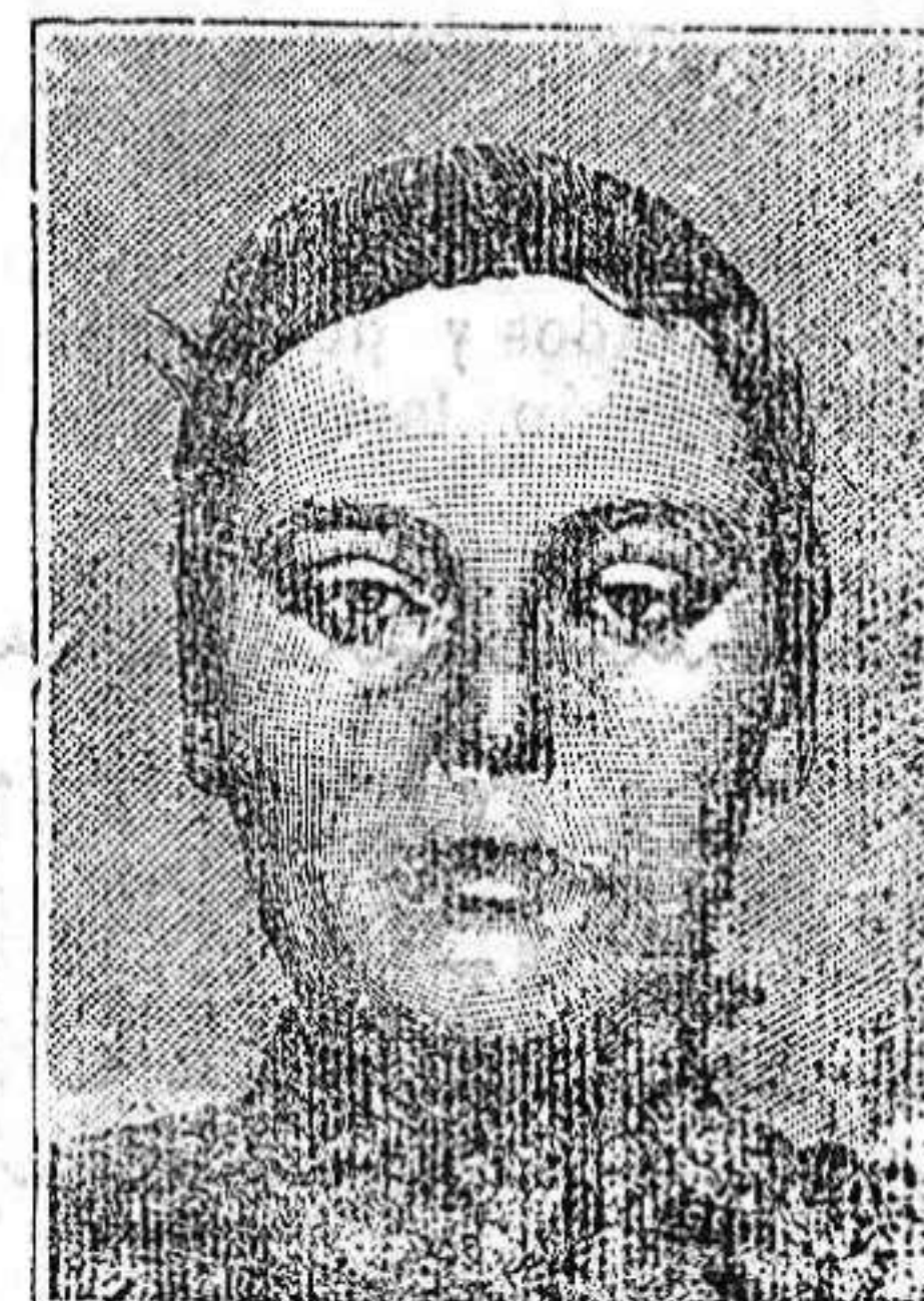
Después de 15 días de la curación