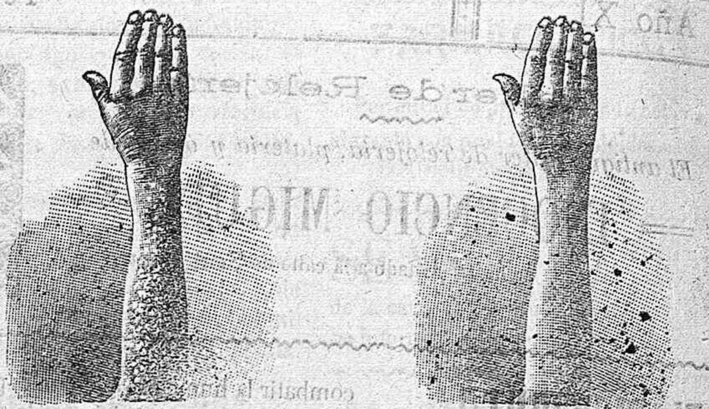
Antes de la curación Después de 15 días de curación

curación radical de todas las enfermedades de la piel las piernas y del artrismo, reumatismo, gota, dolores etc. por medio del TRATAMIENTO DEL RICHELET