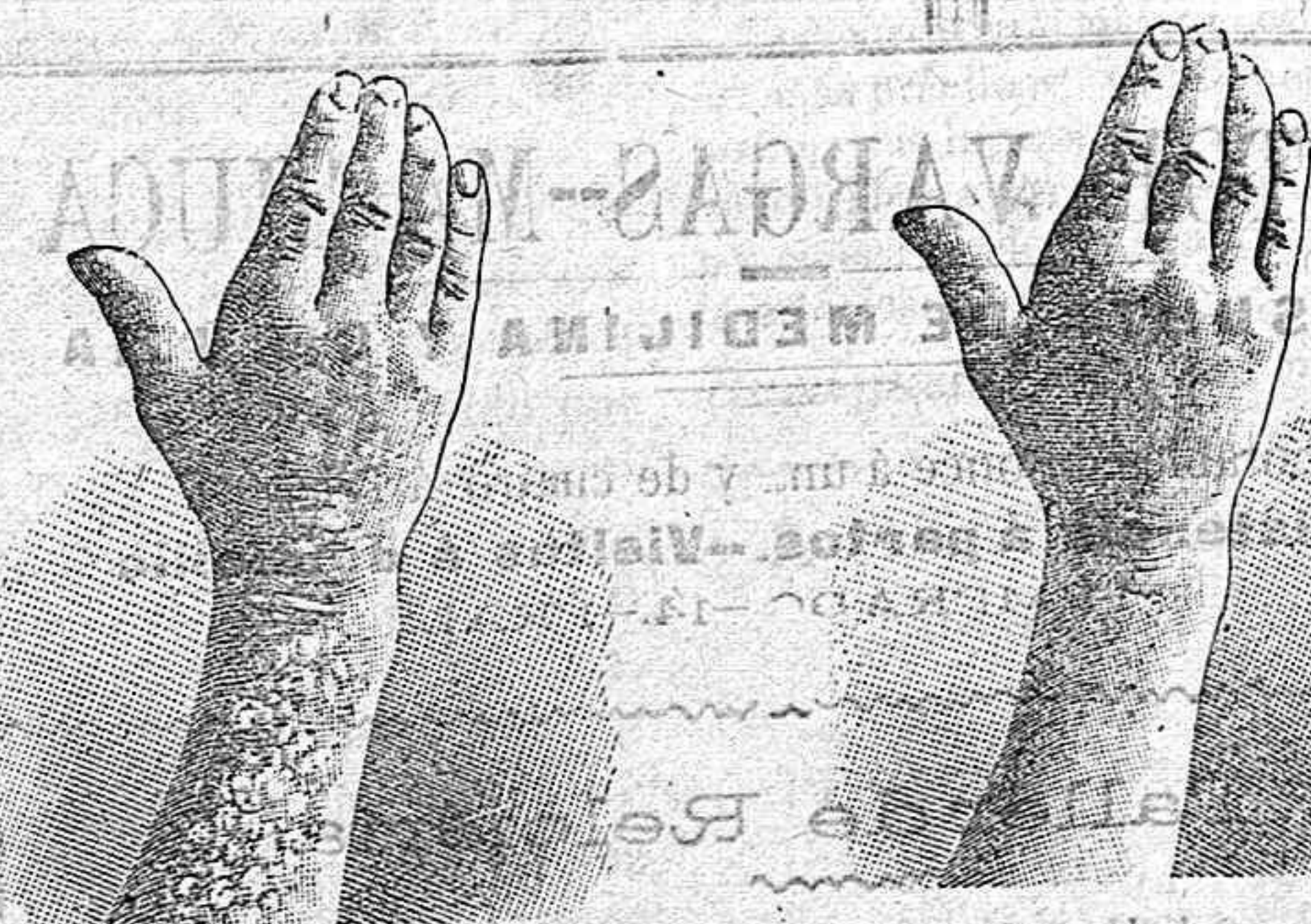
Antes de la curación Después de 10 días de curación

Curación radical de todas las enfermedades de la piel y lasplenas y del artrismo, reumatismo, gota, dolores etc. por medio del TRATAMIENTO DEL RICHELET