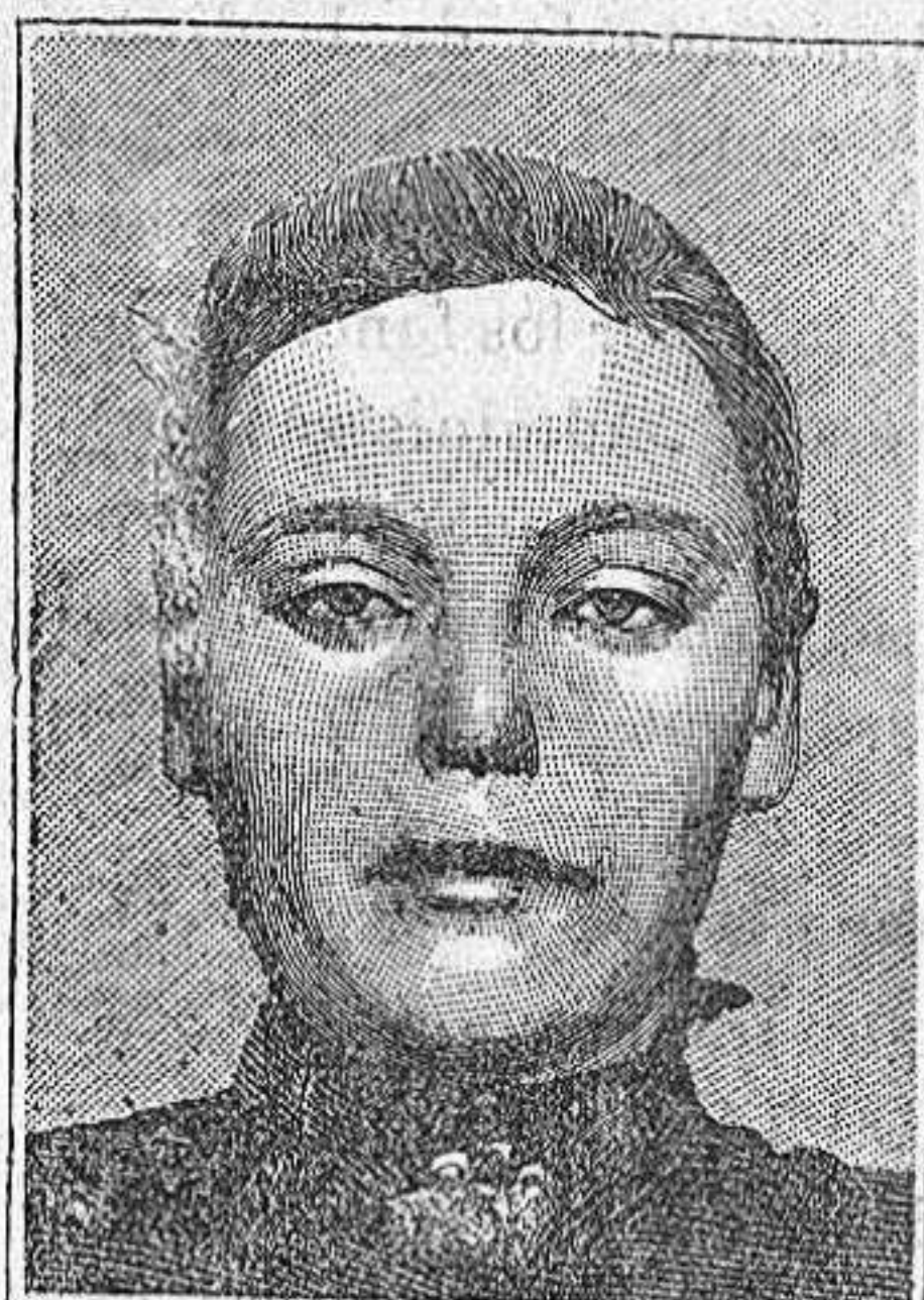
Antes de la curación Después de 15 días de la curación