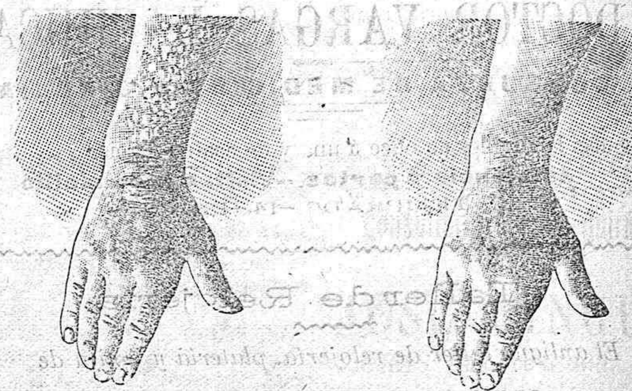
Antes de la curación Después de 10 días de curación

curación radical de todas las enfermedades de la piel y laspias nas y del artritis, reumatismo, gota, dolores etc. por medio del TRATAMIENTO DE L. RICHELET