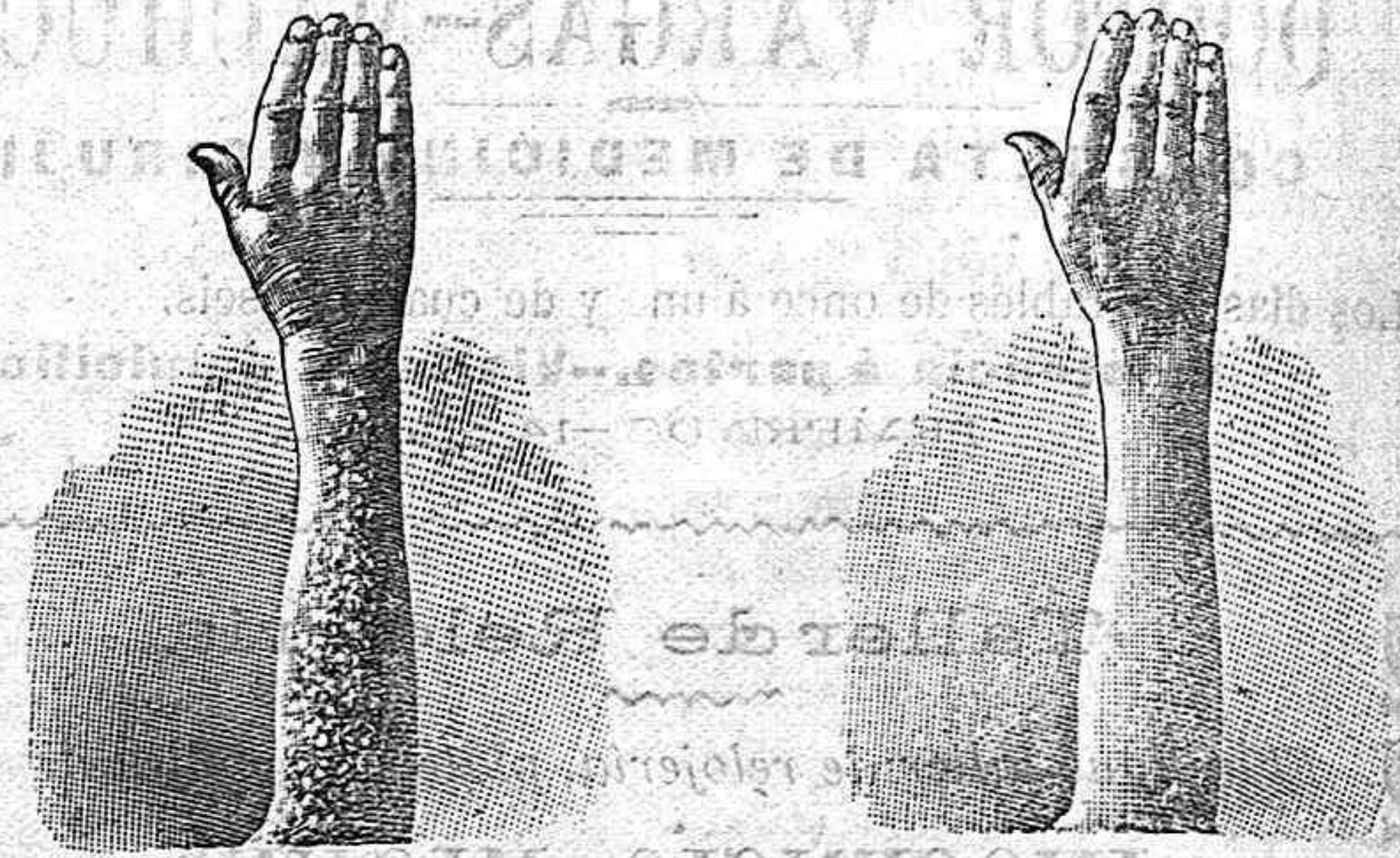
Antes de la curación Después de 10 días de curación

curación radical de todas las enfermedades de la piel y laspias nas y del artrismo, reumatismo gótico, dolores etc. por medio del TRATAMIENTO DEL RICHELET