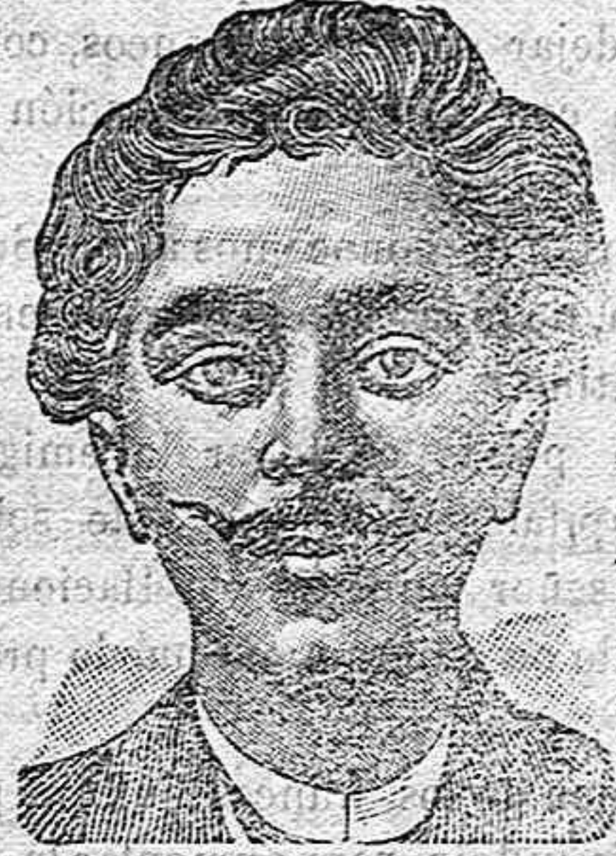
Después de 30 días de curación