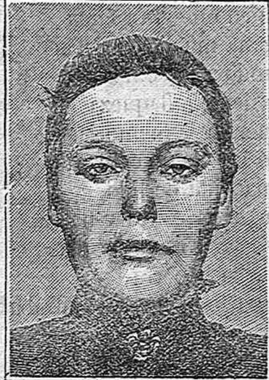
Después de 6 días de curación