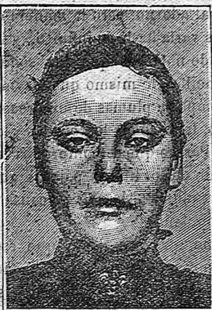
Después de 10 días de curación