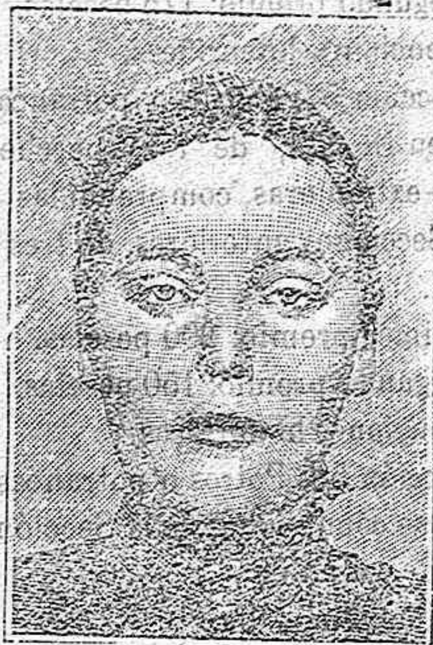
Después de 10 días de curación