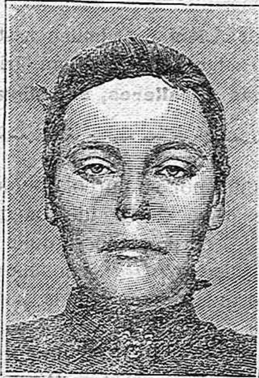
Después de 10 días de curación