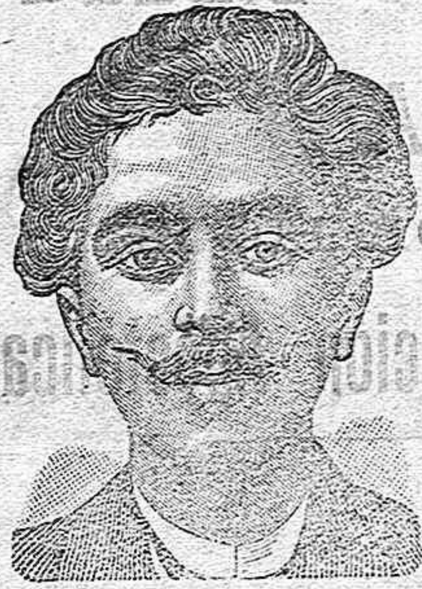
Después de 10 días de curación