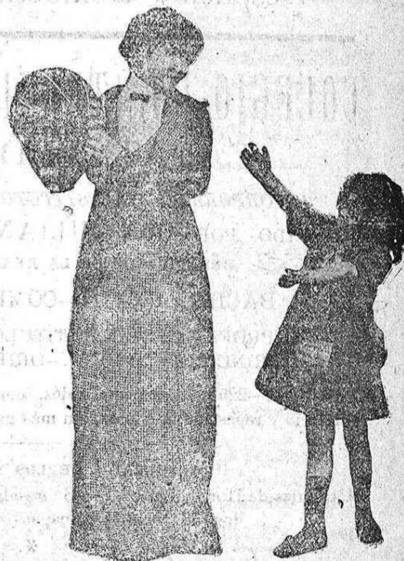
Un episodio de la cinta «La Alondra y el Milano».

Su capital social es de diez millones de pesetas y de acuerdo con sus Estatutos se han amortizado ya este año 56 acciones privilegiadas.