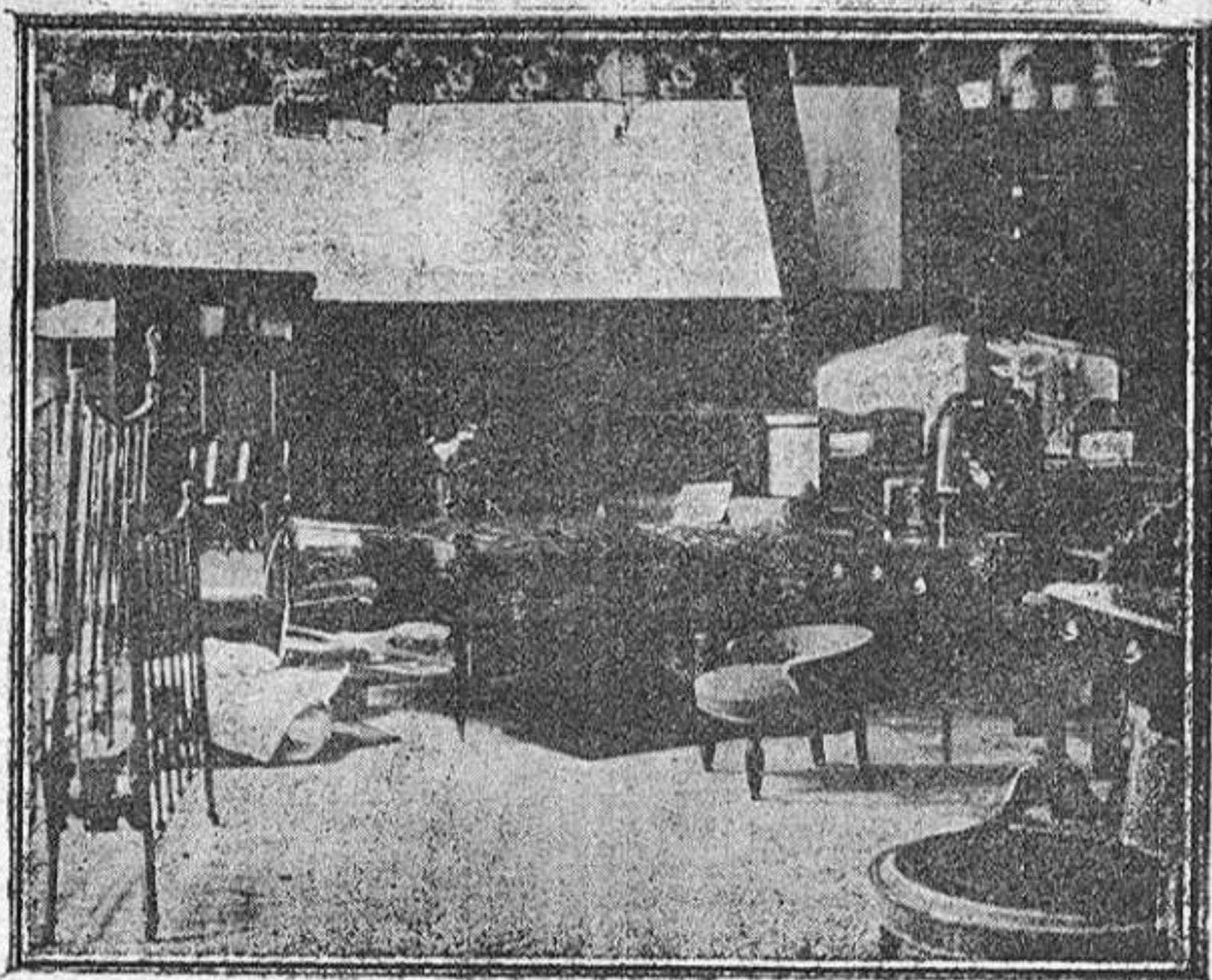
Un detalle de este Establecimiento