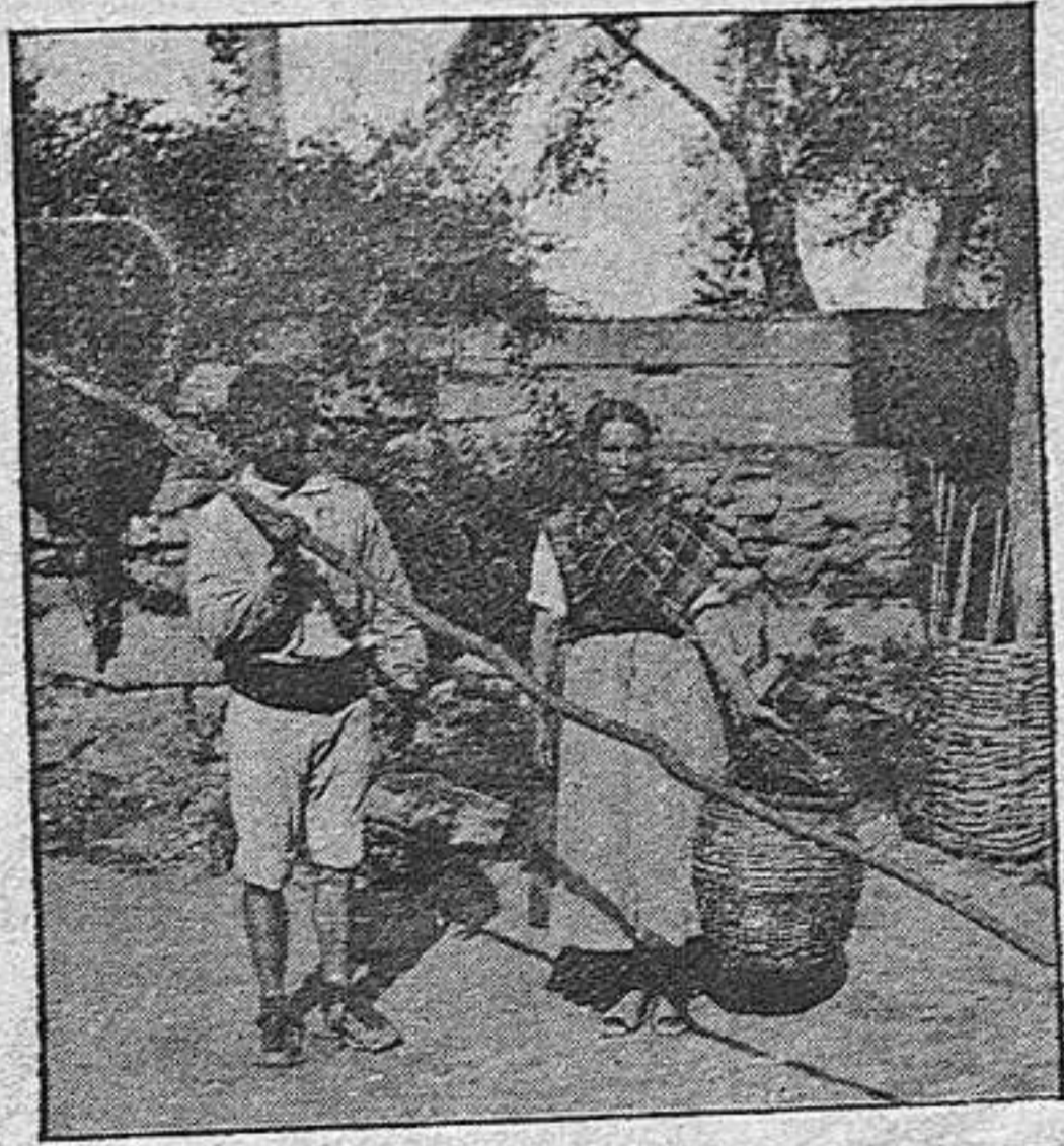
Pescadores de la estanca. — Aloañiz.