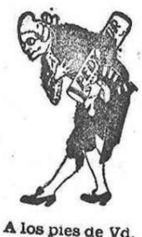
A los pies de Vd.

El maravilloso baño de pies, es la salvación de los delicados pies de la mujer. Permite llevar calzado ajustado sin que se HINCHEN, RECALIENTEN o DUELAN los pies, juanetes o callos por mucho que se ande, pues aumenta considerablemente su resistencia al cansancio y al calor. Lea estas pruebas irrefutables: