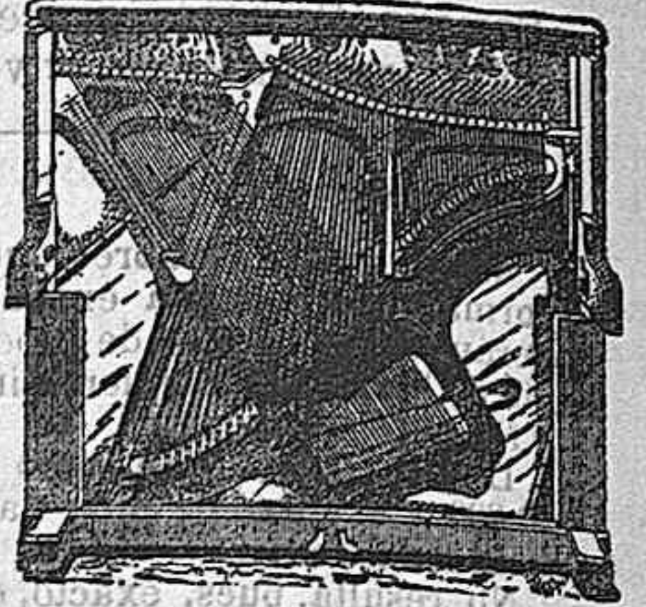
Interior del piano

Fábrica y depósito en Barcelona, con marco de hierro, barra de presión corrida y clavijero de metal nikelado.