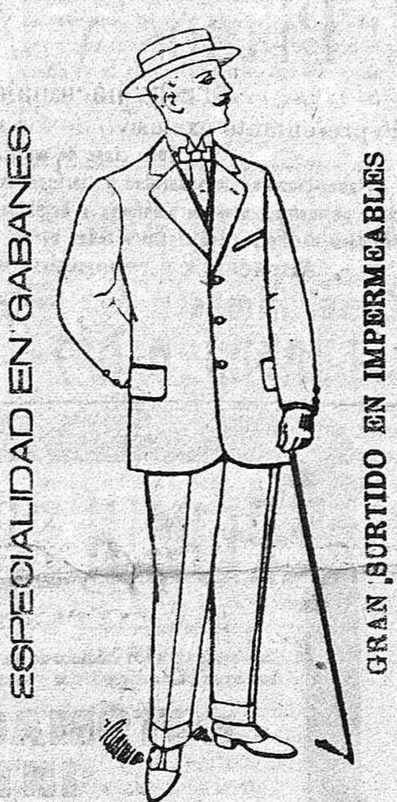
ESPECIALIDAD EN GABANES

CASA IBARRA Fundada en 1870 Especialidad en trabajos para talleres y máquinas, especial para la fundición