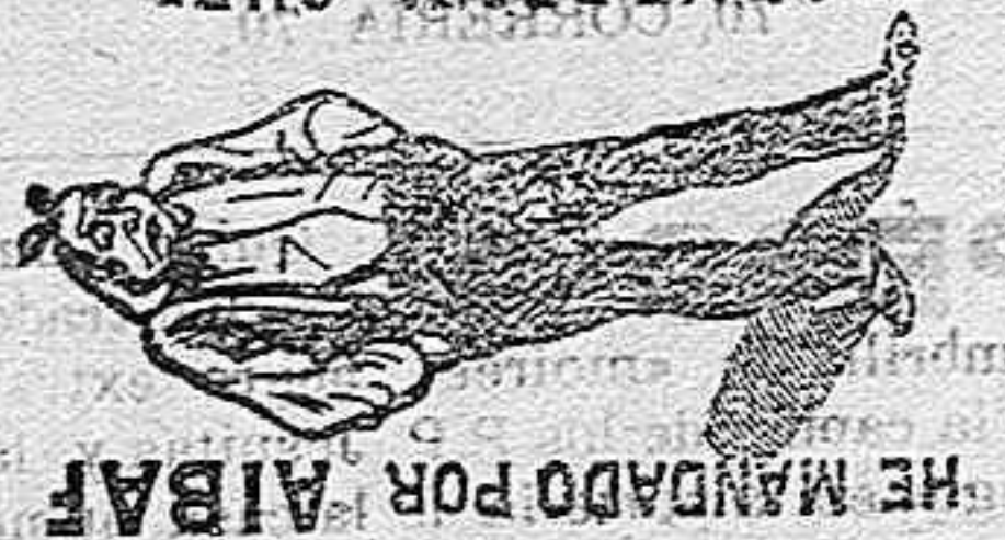
HE MANDADO POR AIBAL