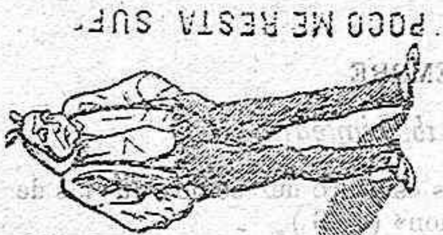
HE MANDADO POR AIBAF