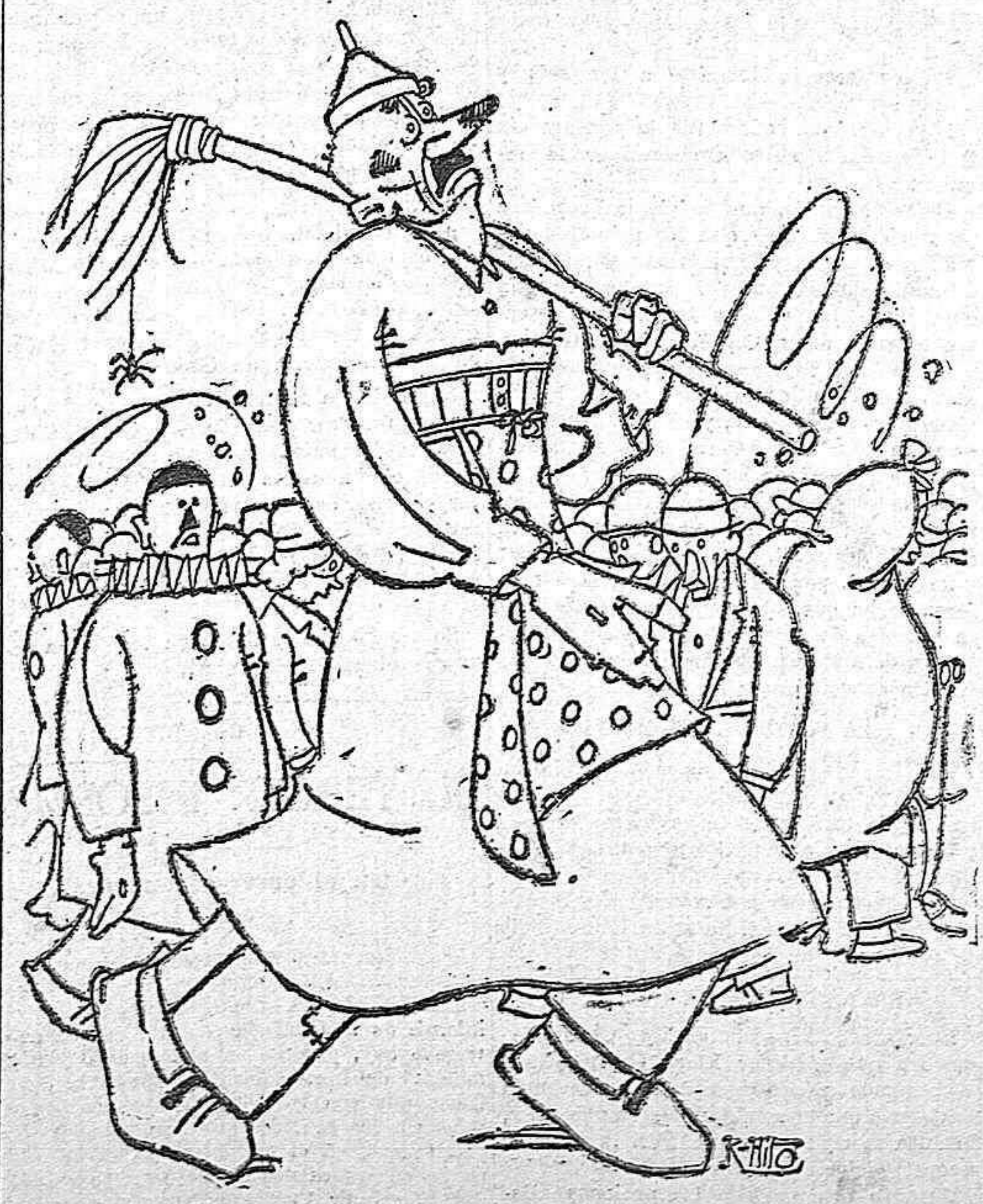
Renacimiento. (Epoca actual).