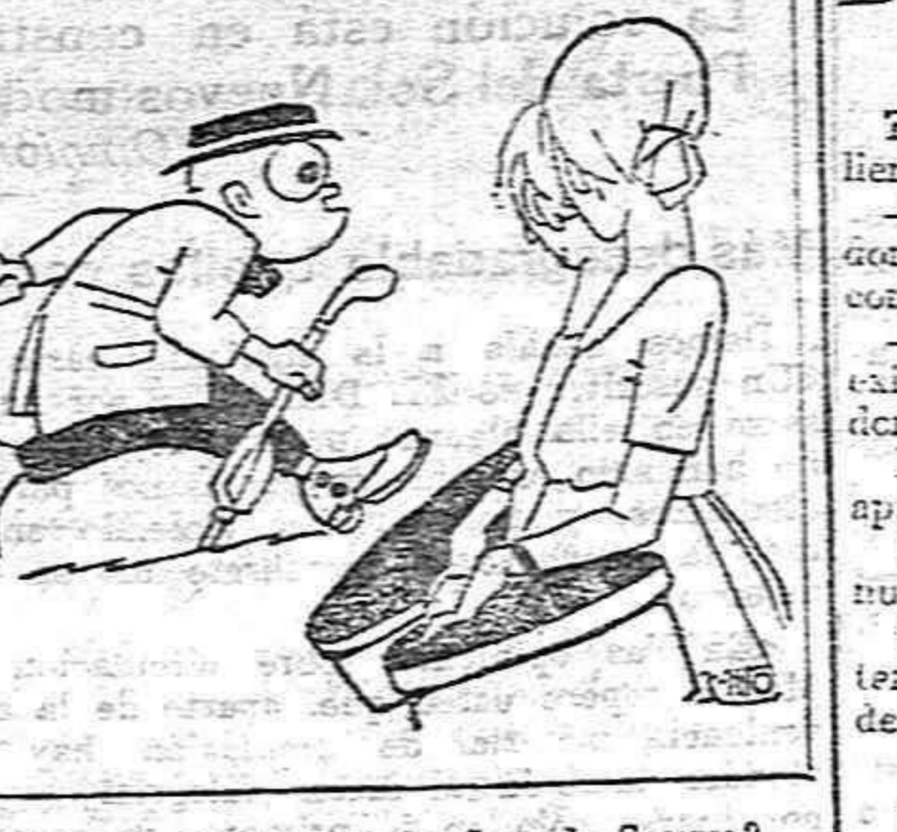
—Ay, ¿dónde está la Casa de Socorro? —Oye, Rosita, ¿te has fijado en ese pollo? ¡Qué buenos ojos tiene!